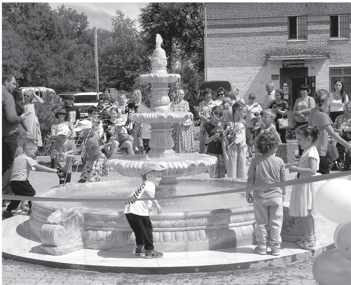
Благодаря местным активистам ТОСа «Лотос» фонтан украсил село Полётное.