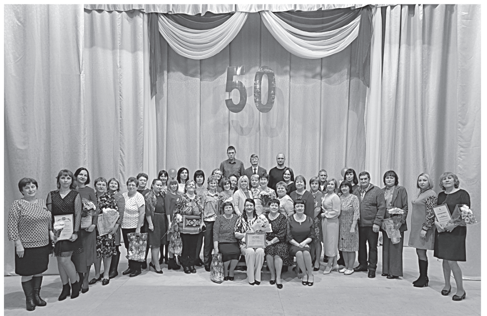
Нам – 50!