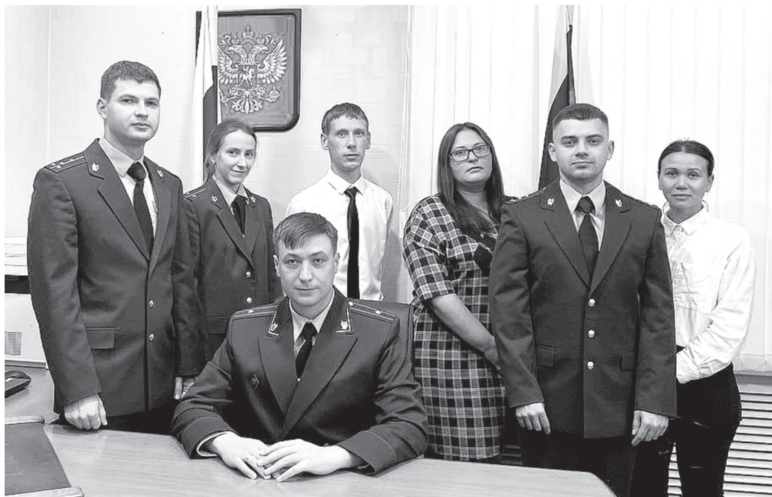
Мы – на страже закона.

В 2022 г. благодаря принципиальной позиции прокуратуры района и принятому комплексу мер прокурорского реагирова-