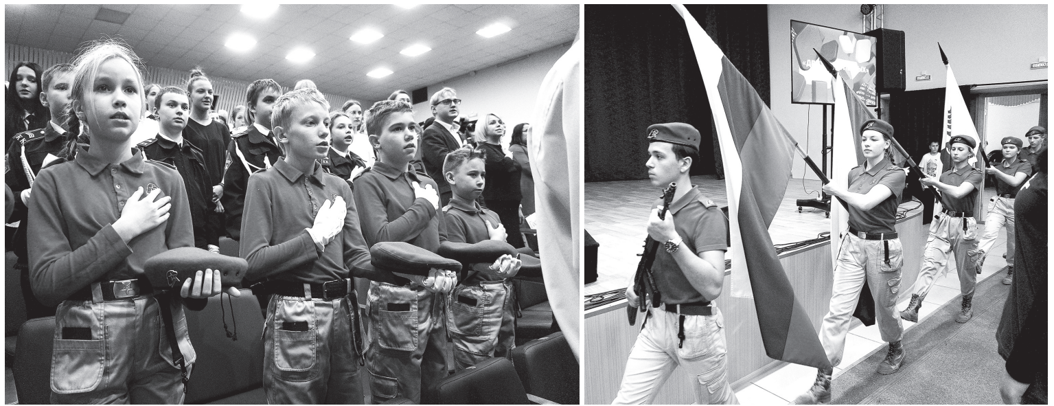
В «Движении Первых» задачи ясны. Жить и творить во благо страны!

Эстафету принял и наш район. Зал ДК «Юбилейный», где проходило торжество, еле вместил всех желающих принять участие в этом событии. Ведь вступить в ряды районной организации «Движение Первых» изъявили желание более 400 учащихся из школ Переяславки, Переяславки-2, Хора, Мухена, Георгиевки, Бичевой, Ситы, Черняево, Могилевки, Полетного, Кругликово, Новостройки, Соколовки, Сидимы и студенты Хорского агропро-