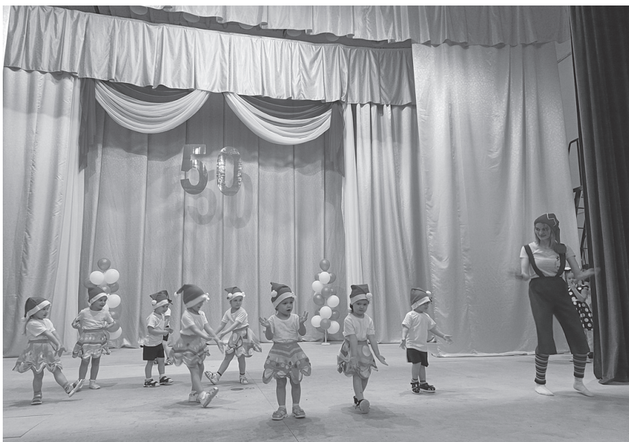
Творческий подарок от малышей детсада.

8 декабря детский сад № 18 п. Мухен отметил свой 50-летний юбилей. За эти годы он выпустил в большую (школьную) жизнь около 1300 детишек.