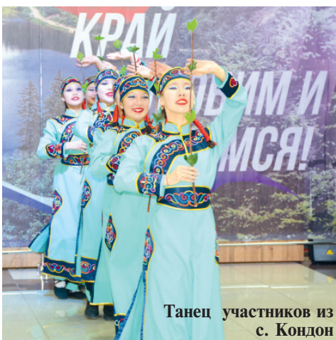
Танец участников из с. Кондон

Не менее вкусными были блюда и других участников. Например, Центр Досуга п. Хурмули совместно с творческим объединением «Весёлые ребята» представляли казачью кухню. На их столах все овощи и ягоды были выращены с любовью и собраны с Дальневосточного гектара. Тут и клюква под «снежком» (присыпанная сахарной пудрой), салат «Заячья капуста» - всё, что любит зайчик: капуста, морковь и яблоко; домашняя картошечка с мясом, которая выложена в форме поросёнка, сверху украшена кусочками теста (ушки и хвост), тут есть своя хитрость в приготовлении: по подрумяненному тесту определяется готовность блюда. Солёные огурчики, вишневый компот, каша казачья донская и это ещё не всё, что было представлено на суд зрителям, с песнями под гармошку.