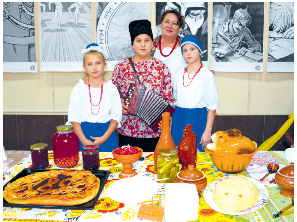
Участники Центра досуга п. Хурмули с казачьей кухней