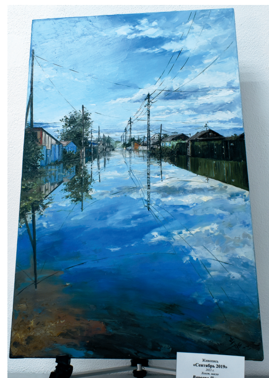
Живопись «Сентябрь 2019»