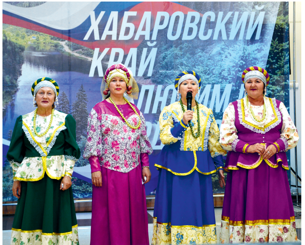
Музыкальное выступление участников Центра досуга п. Дуки

Танцевальный коллектив «Леди денс» п. Солнечный представили еврейскую кухню, перед этим станцевали национальный танец. Одним из представленных ими блюд был форшмак.