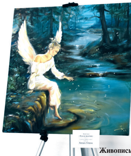
Живопись «Чудо в мелочах», «Пионы»