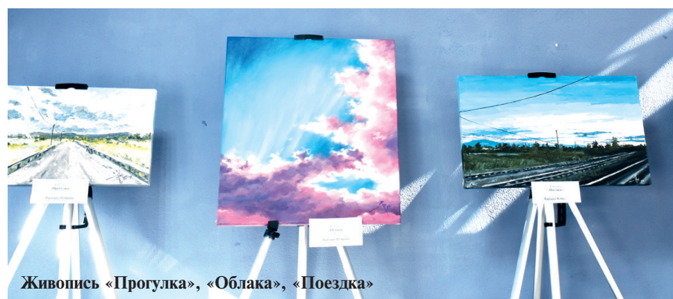
Живопись «Прогулка», «Облака», «Поездка»

Я занималась и эпоксидной смолой, потом начала рисовать масляными красками. Первый раз они мне показались безумно сложными, но постепенно стала проникаться к этой технике — масляной живописи