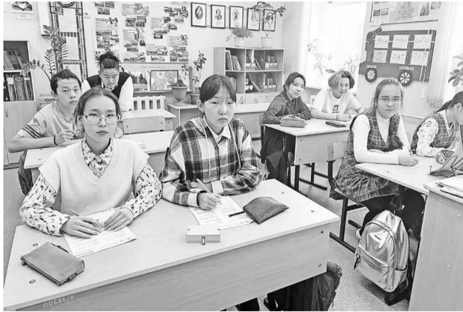
Фото: школа имени Акима Самара села Кондон Солнечного муниципального района Хабаровского края

Организатором диктанта является Федеральное агентство по делам национальностей, при поддержке