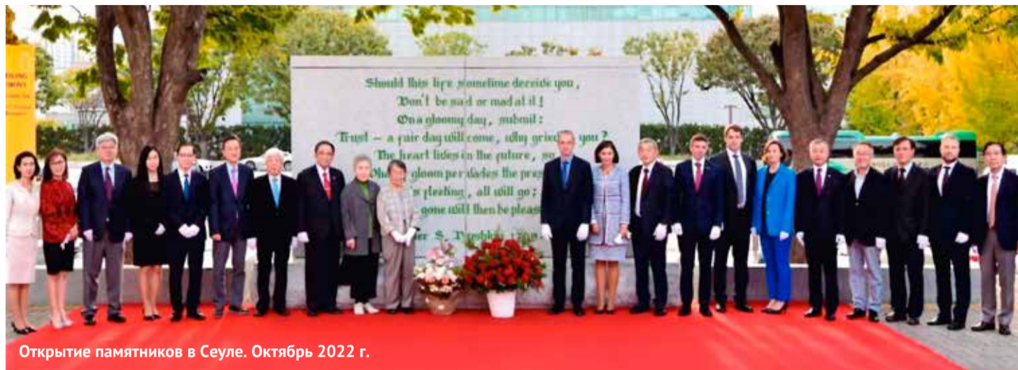
Открытие памятников в Сеуле. Октябрь 2022 г.