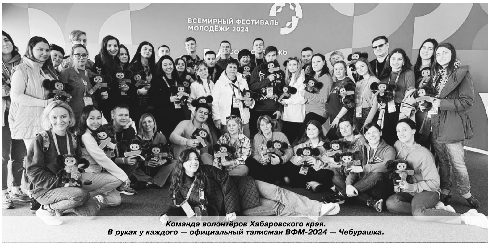
Команда волонтеров Хабаровского края. В руках у каждого — официальный талисман ВФМ-2024 — Чебурашка.

— Мне поступил звонок из правительства Хабаровского края с предложением представлять наш регион на фестивале в качестве атташе при делегации волонтеров и участников. Разумеется, я согласился. Поездка стала возможна благодаря финансовой поддержке Хабаровского края, Николаевского района и Федерального агентства по делам молодёжи (Росмолодёжь). В Хабаровске я встретился с командой волонтеров численностью 43 человека, и за неделю до начала фестиваля мы вылетели в Москву. Там переночевали, а на следующее утро нас встретили волонтеры РЖД. Российские железные дороги, партнёр Всемирного фестиваля молодёжи, предоставили несколько железнодорожных составов, в том числе и для волонтеров. Делегации регионов Дальнего Востока разместились в одном составе. На вторые сутки мы прибыли в Сочи. На вокзале нас приветствовали местные волонтеры, сопроводили в гостиничный комплекс «Бархатные сезоны», разместили, и началась подготовка к фестивалю. Волонтеры прошли обучение, каждый из них получил свою задачу: это и поддержка участников фестиваля, и информационное обеспечение, и участие в организации мероприятий, и многое другое. А я как атташе занимался отдельно от них. Меня провели по всем объектам, показали все быстрые пути перемещения между ними, чтобы не было проблем с ориентированием. К 1 марта, то есть к открытию Всемирного фестиваля молодёжи, наша волонтерская команда была полностью подготовлена к приёму участников.