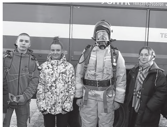
Экскурсия в ПЧ была интересной.