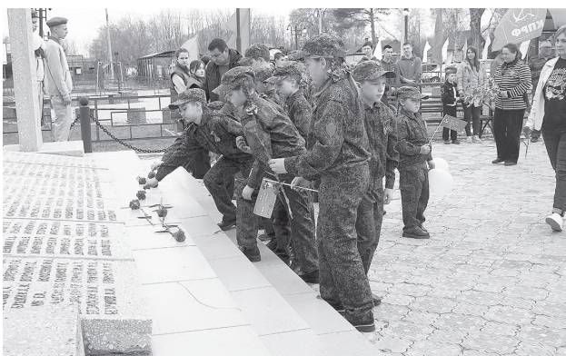
И помнит мир спасённый!