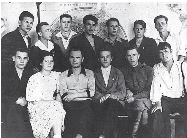
Всем классом эти выпускники 1941 года Полётненской средней школы ушли на фронт.

Они – об артиллеристах, разведчиках, пехотинцах, танкистах, связистах, радистах... Вспомним их поименно!..