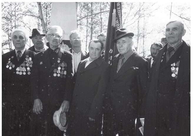
Лазовские фронтовики у памятника героям Гражданской войны в сквере Лазо в Переяславке