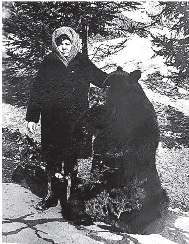
Моя бабушка, 1982 г., Санаторий «Кульдур»

В доме бабушки всегда было тепло и уютно. На кухне и в