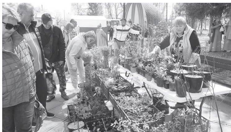
Народ прохаживался, присматривался, приценился.