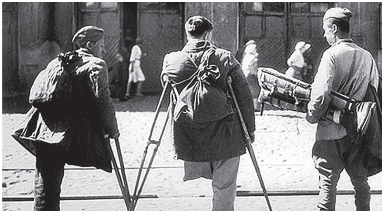
«Сквозь года, сквозь века – Помните!...». (Фотоархив фронтовых лет)

Всю жизнь я живу в Переяславке, за исключением учёбы в институте и 5-летней после него отработки в Якутии. Хорошо помню те военные и послевоенные годы, когда немало было раненых и калек, вернувшихся с фронтов.