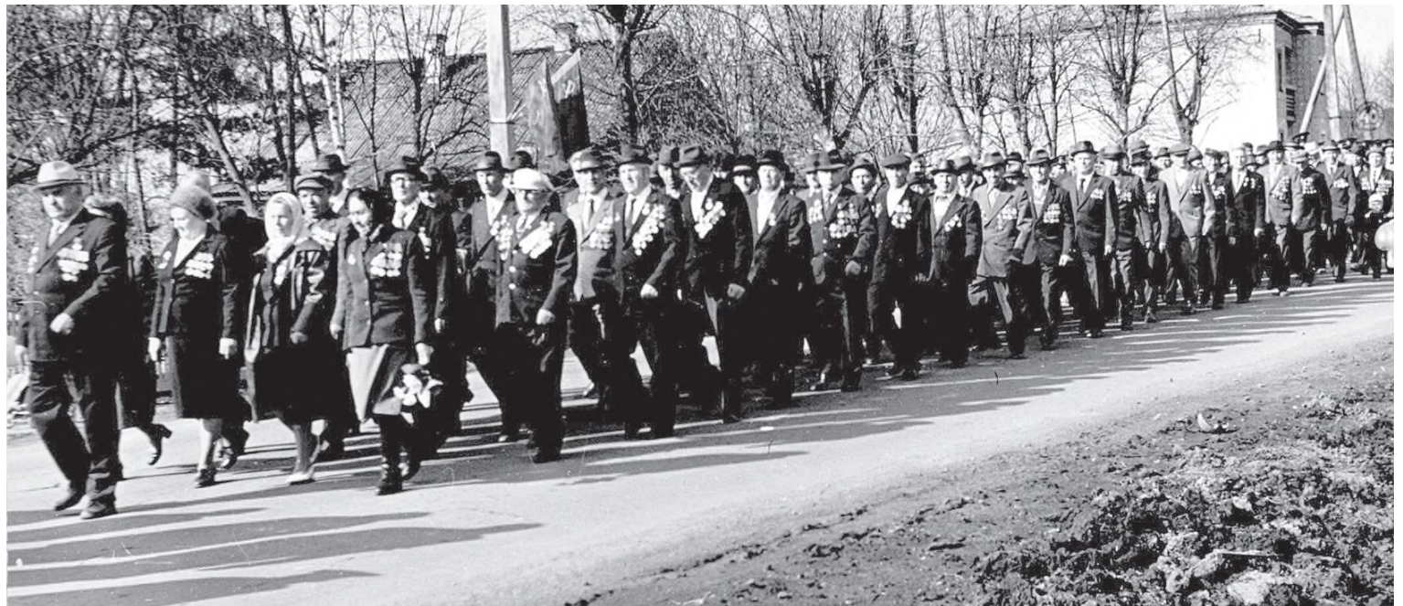
Они сражались за Родину!