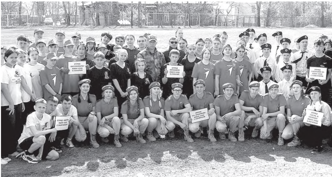
Участники «Зарницы»

Школьные активисты и спортсмены – это ещё и будущие защитники нашей Родины. Многие из них стремятся достичь в жизни высот и добиться поставленной цели.