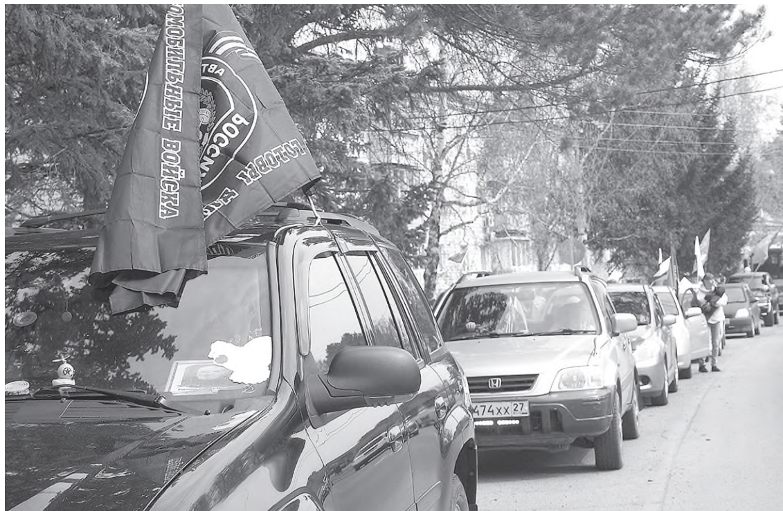
К пробегу «Километры Памяти» – готовы!

Далее короткая остановка на трассе близ Марусино и возло-