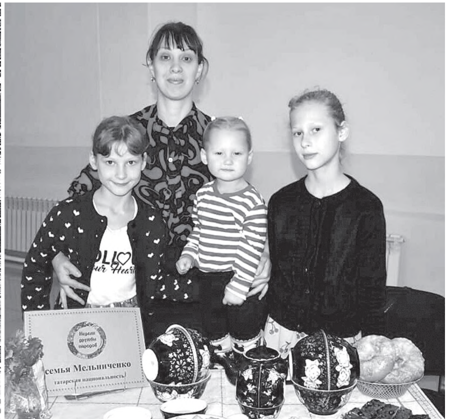
На «Хороводе дружбы» мы с дочками рассказывали о татарской культуре, обычаях и национальной еде.

зале, в серванте, стояло много расписных, с причудливыми узорами, татарских кувшинов и чайничков из глины. В одной бабушка обычно хранила молоко и масло, заваривала ароматные, с травками чаи, а другие использовала только по праздникам.