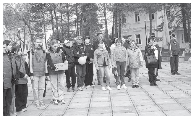
Отправная точка – площадь Ленина в районном центре

В каждом селе участники автопробега делали общее фото с жителями – на память о незабываемом майском событии.