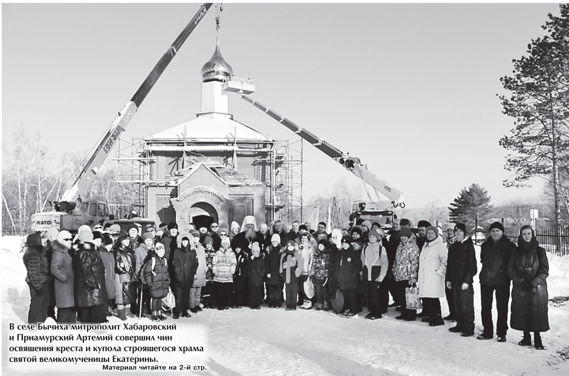
В селе Бычиха митрополит Хабаровский и Приамурский Артемий совершил чин освящения креста и купола строящегося храма святой великомученицы Екатерины. Материал читайте на 2-й стр.