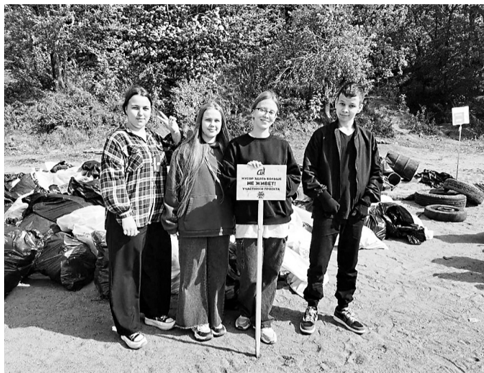
Квест прошёл в рамках Всероссийского чемпионата по сбору и сортировке мусора «Евразийский кубок чистоты».

В Хабаровске на старом заводе «Дальдизель» прошёл ежегодный экологический квест «Чистые игры». Это командные соревнования по очистке зелёных территорий, где участники соревнуются в сборе и сортировке мусора и выигрывают призы.