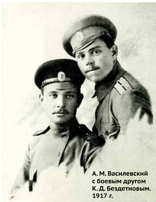
А. М. Василевский с боевым другом К. Д. Бездетновым. 1917 г.