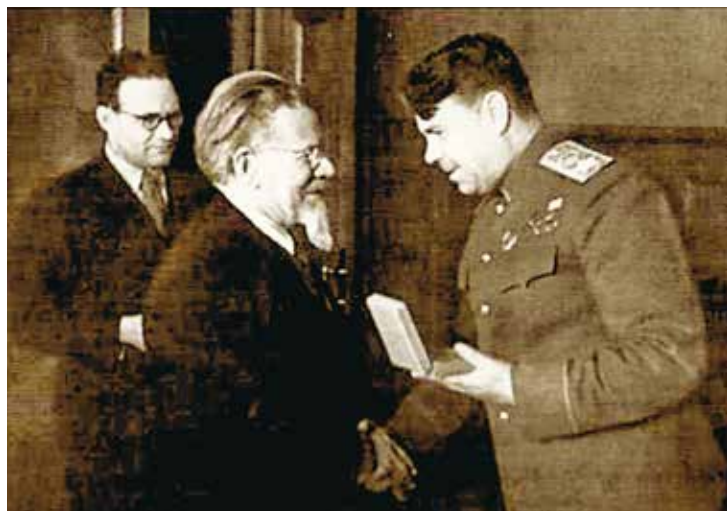
М. И. Калинин вручает А. М. Василевскому награды после победы на Дальнем Востоке. Сентябрь 1945 г.