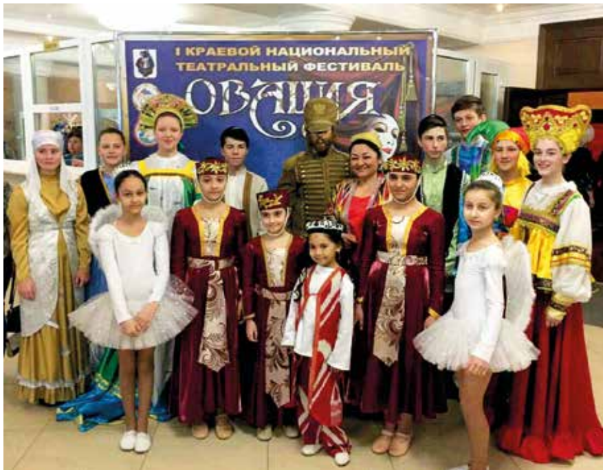
Танцоры армянской школы