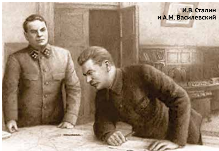
И.В. Сталин и А.М. Василевский