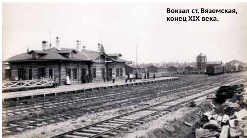
Вокзал ст. Вяземская, конец XIX века.

При проектировании железной дороги было выбрано место под будущую станцию, которой дали условное название Медвежий. К поселению строителей весной 1895 года присоединились 15 переселенцев-крестьян и две семьи казаков. В дальних окрестностях землю вдоль границы с Китаем по реке Усури к этому моменту уже не одно десятилетие осваивали казаки Забайкальского казачьего войска и их семьи. Военизированные поселенцы крепко встали на рубежи и поставили станицы Кукелево, Кедрово и Веню-