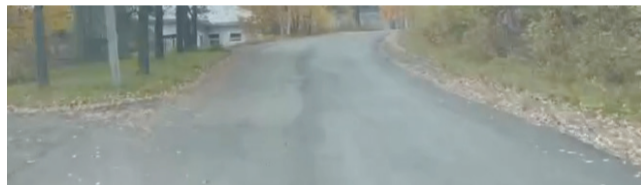
На фото: асфальтированная дорога в п. Солони