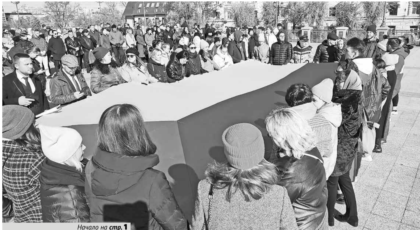
Начало на стр. 1