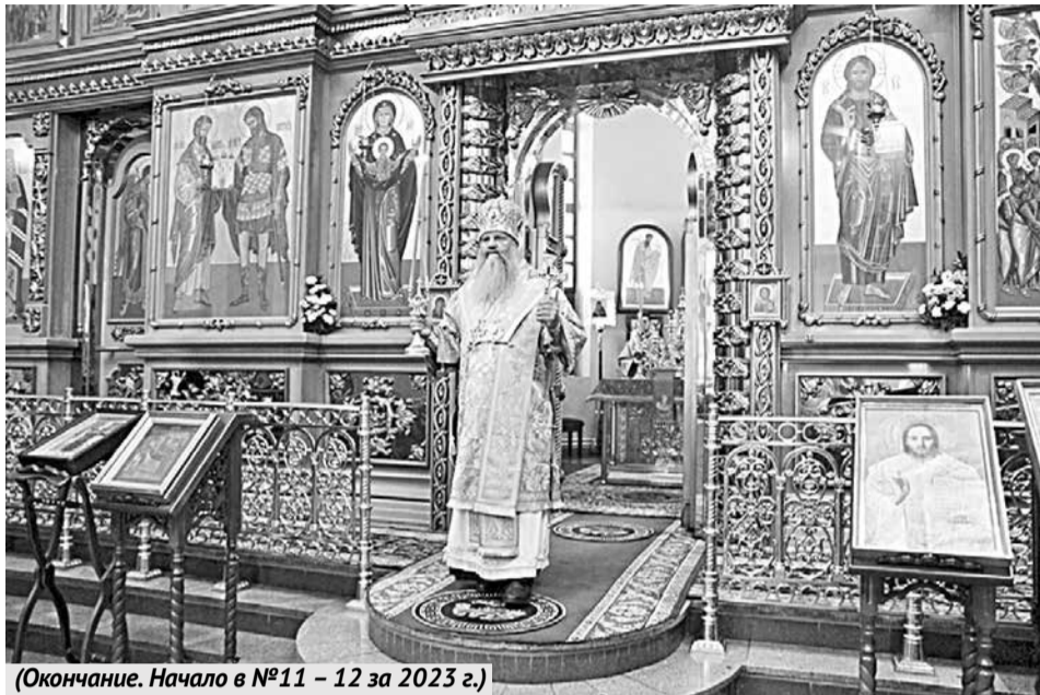
(Окончание. Начало в №11 – 12 за 2023 г.)

О первом каменном и одном из крупнейших храмов Хабаровска: его строительстве, сносе и возрождении.