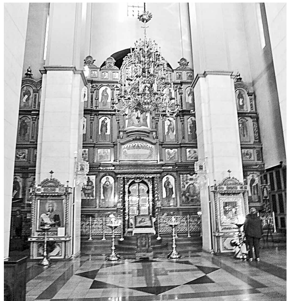
Иконостас нового Успенского собора

АЛБАЗИНСКАЯ ИКОНА ПРЕСВЯТОЙ БОГОРОДИЦЫ «СЛОВО ПЛОТЬ БЫСТЬ» – САМАЯ ИЗВЕСТНАЯ, САМАЯ СЛАВНАЯ СВОЕЙ ДРЕВНОСТЬЮ, СВОИМИ ЧУДЕСАМИ ПРАВОСЛАВНАЯ СВЯТЫНЯ НА ДАЛЬНЕМ ВОСТОКЕ.