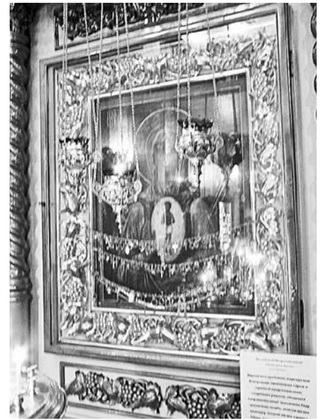
Икона Божией Матери Албазинской «Слово плоть бысть»

Собрался народ. Потерю все стали горько оплакивать и затем начали искать повсюду икону. И – о чудо! – икона обнаружилась на другом берегу реки вместе с начатым срубом и заготовленными бревнами. Так икона сама окончательно избрала место своего пребывания.