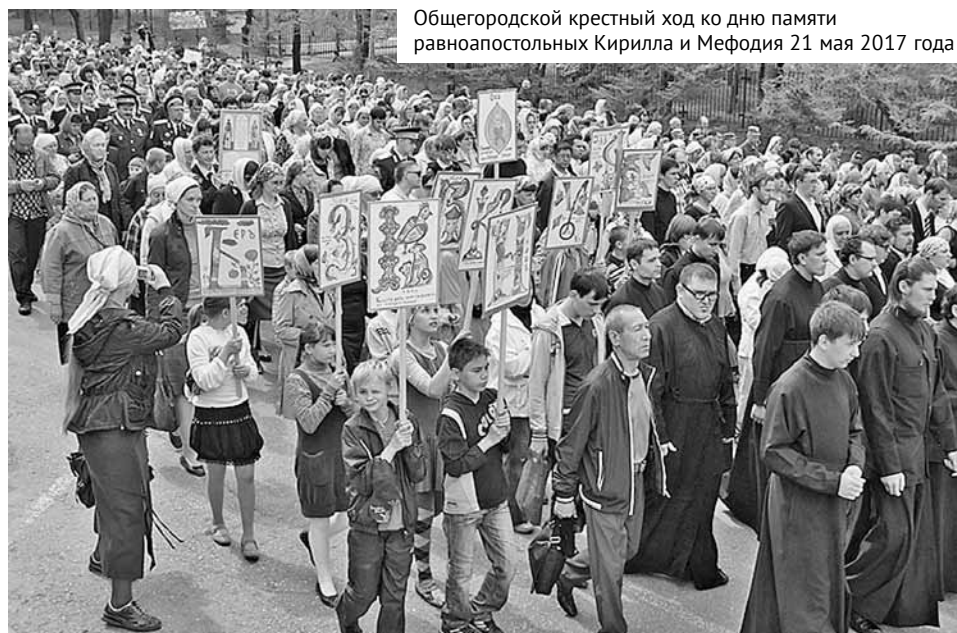
Общегородской крестный ход ко дню памяти равноапостольных Кирилла и Мефодия 21 мая 2017 года