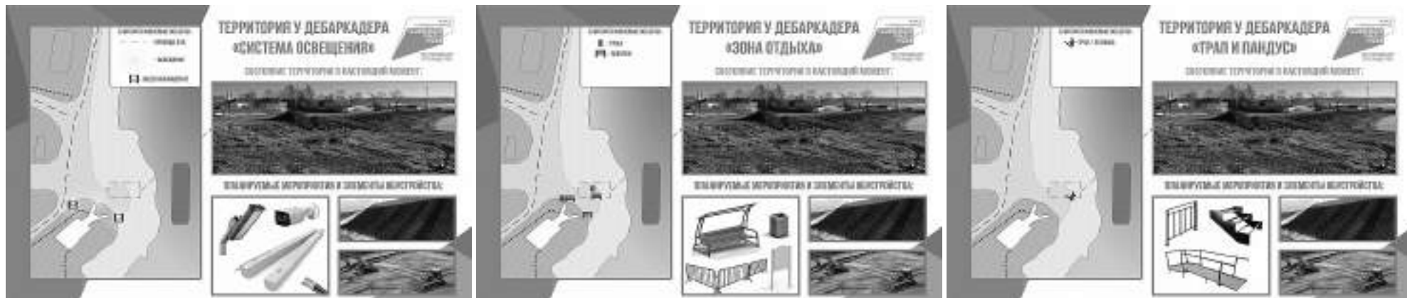
Фото администрации сельского поселения "Село Богородское"