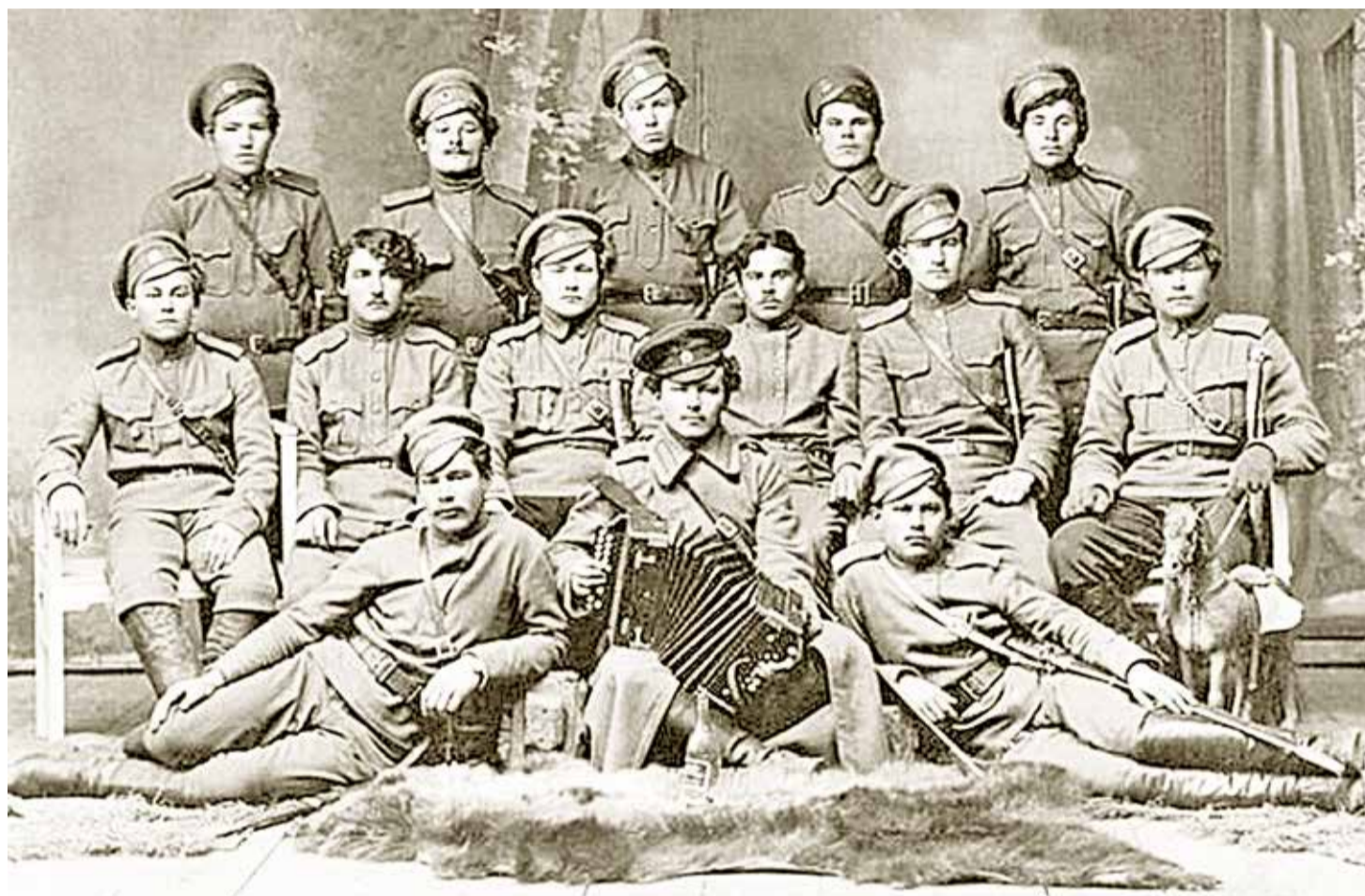
Амурские казаки. 1918 год.

Известно, что изготовлена была братина в ювелирной мастерской Хлебникова в Москве в 1867 году. И, вероятнее всего, не в единственном числе, подобные «подарочные заказы» поступали в эту мастерскую от других казачьих атаманов Российской империи. Сначала братина