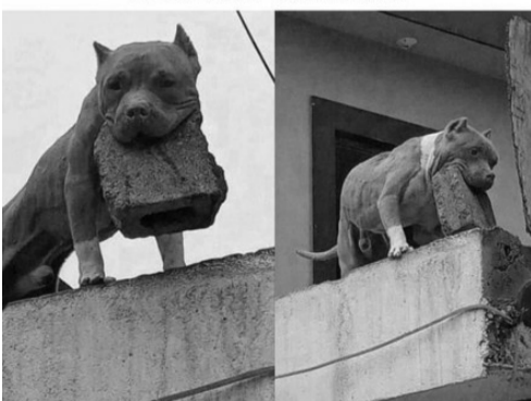
Мой уровень гостеприимства