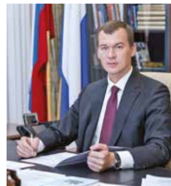
Губернатор Хабаровского края Михаил Дегтярев

Благодарю всех работников отрасли за добросовестный труд и верность избранному делу! Желаю здоровья и благополучия вам и вашим семьям! Веры, надежды и любви! Ведь любовь к России и Хабаровскому краю – это то, что нас объединяет!