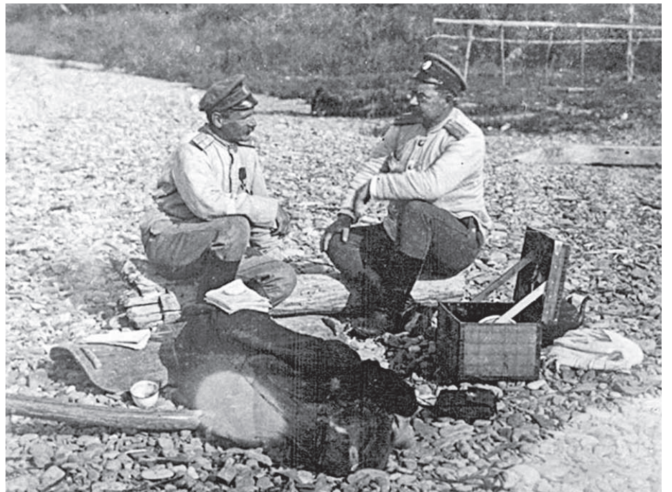
Владимир Клавдиевич Арсеньев (слева) в экспедиции