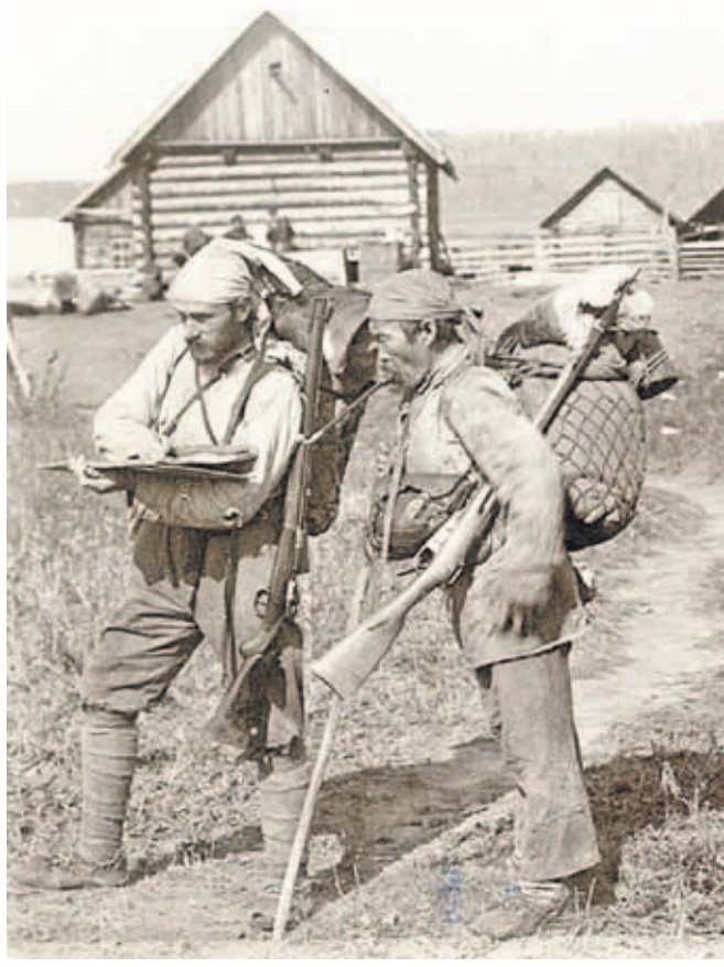
Владимир Клавдиевич Арсеньев и Дерсу Узала

анемометр, геологический молоток, фотоаппарат, химические реактивы. Более громоздкое имущество укладывалось в ящики, обитые брезентом, или в джутовые мешки. Весил этот «багаж» около 200 килограммов, перевозился с помощью лошадей.