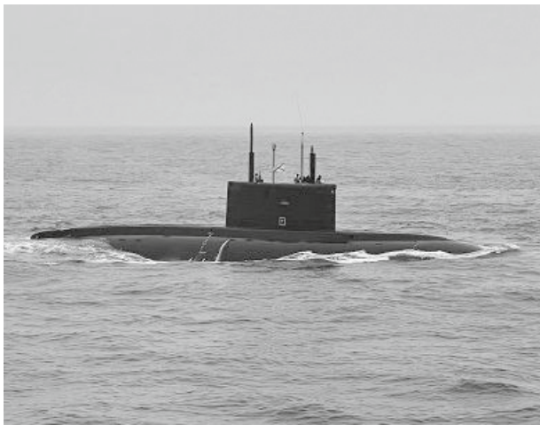
Условно противника «сыграла» дизель-электрическая подводная лодка

Город Юности участвует в национальном проекте «Безопасные качественные дороги» с 2019 года. За это время было отремонтировано 137 объектов (свыше 170 км). В этом году к ним прибавятся ещё 23 объекта протяжённостью 33 километра.