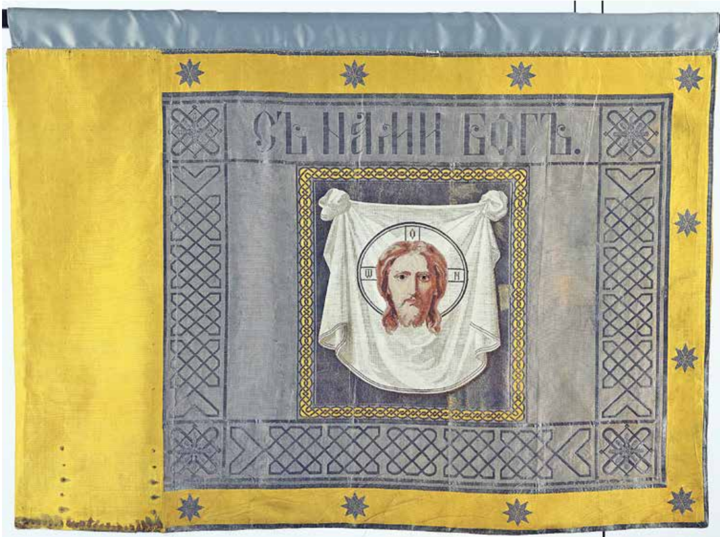
Знамя Уссурийского казачьего дивизиона 1914 г.

В Русской императорской армии регалиями почитались высочайше пожалованные частям войск знаки отличия, вручение которых сопровождалось церемонией освящения. В ходе многолетнего исследования авторы обнаружили документы, раскрывающие обстоятельства пожалования в 1914 г. и вручения в 1916 г. ранее почти не известной регалии — знамени Уссурийского казачьего дивизиона — вновь образованной в Первую мировую войну строевой части Уссурийского казачьего войска.