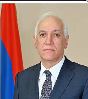
Ваагн Хачатурян.

14 октября Президент Армении Ваагн Хачатурян (на фото) подписал закон о ратификации Римского статута Международного уголовного суда (МУС). До этого, 3 октября, этот закон был принят армянским парламентом. МУС был учреждён в 1998 году на конференции в Риме. Он рассматривает дела, связанные с геноцидом, военными преступлениями и преступлениями против человечности. Расположен этот суд в нидерландском городе Гааге, поэтому в русской разговорной речи его часто называют просто "Гаагой". В 2022 году, вскоре после начала специальной военной операции, МУС выдал ордер на арест Президента России Владимира Путина. Армянское руководство уже заверило Россию в том, что такой арест, в случае визита Путина в Армению, невозможен - так как главы государств обладают неприкосновенностью. Однако в МИД России всё равно заявили о "неприемлемости" ратификации Римского статута для нашей страны, а также о том, что эта ратификация будет иметь "самые негативные последствия" для российско-армянских отношений.