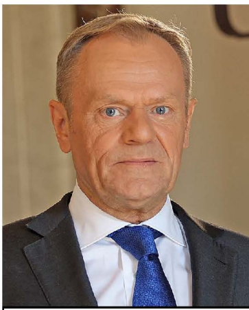
Дональд Туск.

15 октября в Польше прошли выборы в обе палаты парламента - верхнюю (Сенат) и нижнюю (Сейм). На выборах в Сейм первое место заняла правящая консервативно-популистская партия "Право и Справедливость" (Пис), получившая 35,38 % голосов. Второе место заняла либеральная "Гражданская коалиция", возглавляемая бывшим премьером Дональдом Туском (на фото; 30,7%). Третье место - у центристской коалиции "Третий путь" (14,4 %), четвёртое - у партии "Новые левые" (8,61 %). На выборах в Сенат убедительную победу одержал "Сенатский пакт - 2023", объединивший все три основные оппозиционные силы ("Гражданскую коалицию", "Третий путь" и "Новых левых"): 47,73 % против 34,38% у Пис. "Пакт" смог победить благодаря тому, что входившие в него партии договорились не выставлять кандидатов друг против друга. Президент Польши Анджей Дуда (Пис) уже заявил о том, что предложит сформировать правительство своей партии. Но сделать это будет сложно, так как большинство мест в обеих палатах нового парламента будет у оппозиции. Если у Пис не получится сформировать правительство, то президент поручит это Дональду Туску. Одновременно с выборами прошёл референдум по четырём вопросам (среди них - повышение пенсионного возраста до 67 лет и ликвидация стены на польско-белорусской границе). Из-за низкой явки его признали несостоявшимся.