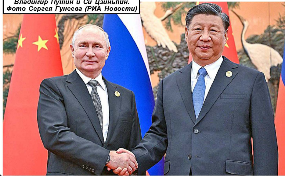
Владимир Путин и Си Цзиньпин.

14 октября Президент Армении Ваагн Хачатурян (на фото) подписал закон о ратификации Римского статута Международного уголовного суда (МУС). До этого, 3 октября, этот закон был принят армянским парламентом. МУС был учреждён в 1998 году на конференции в Риме. Он рассматривает дела, связанные с геноцидом, военными преступлениями и преступлениями против человечности. Расположен этот суд в нидерландском городе Гааге, поэтому в русской разговорной речи его часто называют просто "Гаагой". В 2022 году, вскоре после начала специальной военной операции, МУС выдал ордер на арест Президента России Владимира Путина. Армянское руководство уже заверило Россию в том, что такой арест, в случае визита Путина в Армению, невозможен - так как главы государств обладают неприкосновенностью. Однако в МИД России всё равно заявили о "неприемлемости" ратификации Римского статута для нашей страны, а также о том, что эта ратификация будет иметь "самые негативные последствия" для российско-армянских отношений.