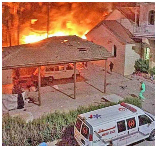
Больница в Газе после удара. Кадр из видео, снятого очевидцем