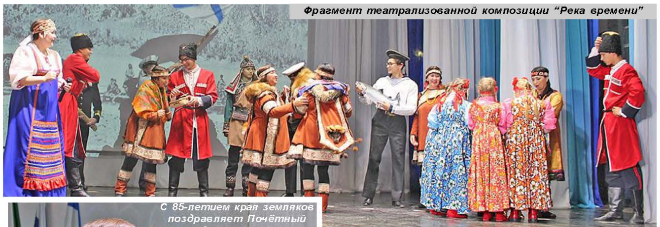
Фрагмент театрализованной композиции "Река времени"