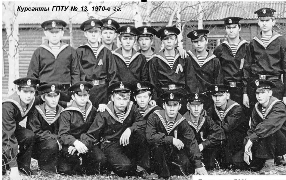
Курсанты ГПТУ № 13. 1970-е гг.

В 1948 году Советская Гавань из Приморского края, училище передали в Хабаровское краевое Управление Трудовых Резервов. 1950-1960 годы были сложными в работе ремесленного училища. Руководители краевого управления ожидали развития училища, судоремонтный завод продолжал строиться и