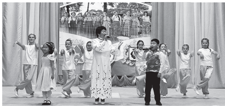
Теперь в Мухене звучит и бурятская речь.

русском, удэгейском, бурятском языках, в хороводе кружились исполнители разных национальностей. В фойе можно было угоститься вкуснейшими блюдами с национальным колоритом – хачапури, пирогами с грибами и картошкой, пирожками с капустой, лепешками с черемшой, тэмпу из рыбы. Все это великолепие приготовили мухенские и гвасюгинские хозяйки.