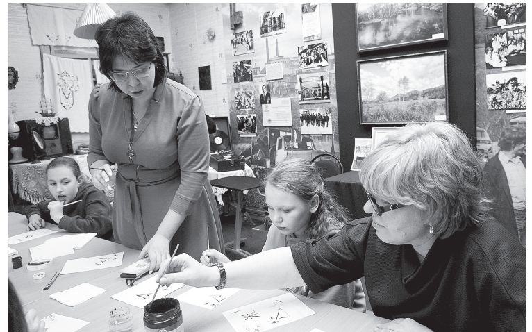
Каллиграфия – это интересно.