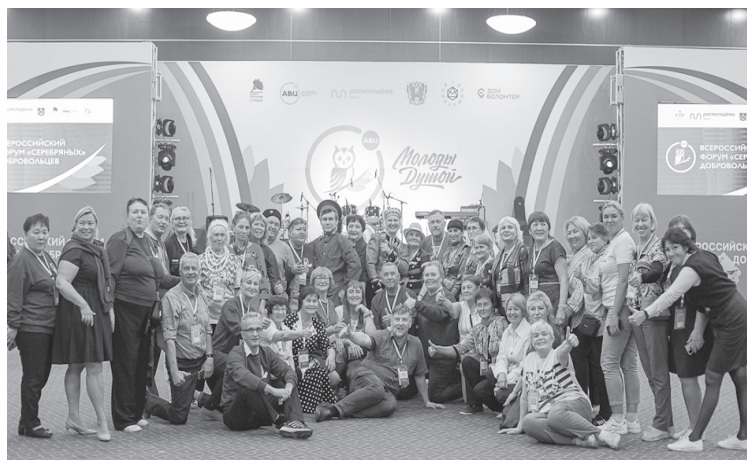
Мы – «серебряные» волонтеры!

движений. На форсайт-сессиях, тренингах, практических занятиях, мастер-классах и деловых играх участники обменивались опытом и успешными практиками, полезными контактами, обсуждали методы включения людей «серебряного» возраста в добровольческую деятельность, говорили о раскрытии лидерского потенциала, формировании сообществ, развитии проектной деятельности.