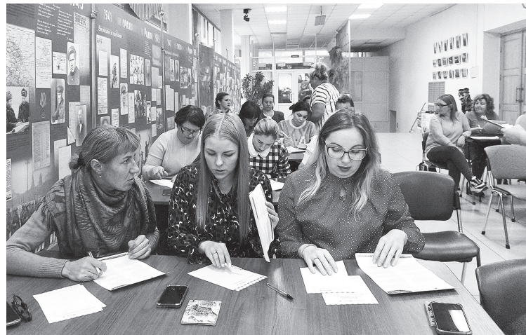
На диктанте было о чем подумать.

Такие акции развивают творческие задатки в детишках и помогают привлечь внимание к экспонатам, повысить интерес к посещению музеев и сделать поход в него занимательным досугом.