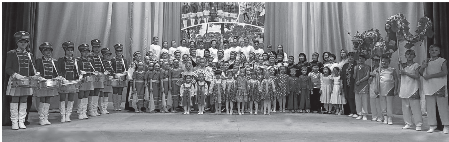
На фестивальной сцене лазовцы разных национальностей

В преддверии Дня народного единства в ДК п. Мухен состоялся традиционный фестиваль «Дружба народов», собравший на одной сцене лазовцев разных национальностей.