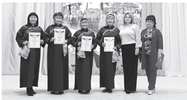
Гости из Гвасюгов