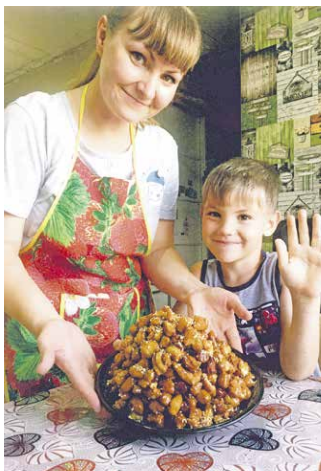
Щирая Анна «Любимое блюдо нашей бабули»