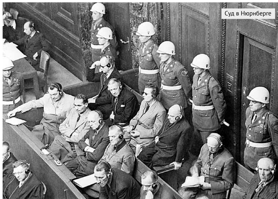
Суд в Нюрнберге

“ ВПЕРВЫЕ ПЕРЕД СУДОМ ПРЕДСТАЛИ ПРЕСТУПНИКИ, ЗАВЛАДЕВШИЕ ЦЕЛЫМ ГОСУДАРСТВОМ И САМОЕ ГОСУДАРСТВО СДЕЛАВШИЕ ОРУДИЕМ СВОИХ ЧУДОВИЩНЫХ ПРЕСТУПЛЕНИЙ, – ГОВОРИЛ В СВОЁМ ВСТУПИТЕЛЬНОМ СЛОВЕ НА НЮРНБЕРГСКОМ ПРОЦЕССЕ ГОСОБВИНИТЕЛЬ РОМАН РУДЕНКО. ”