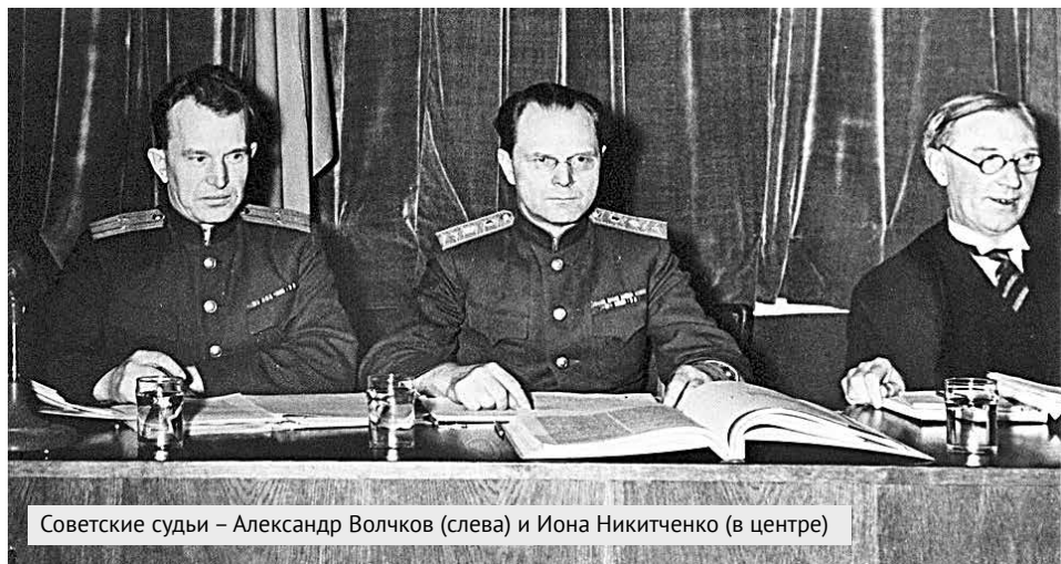
Советские судьи – Александр Волчков (слева) и Иона Никитченко (в центре)

После оглашения приговора первого в истории человечества суда над высшим руководством целой страны прошло 75 лет. Но до сих пор начавшийся в Нюрнберге и завершённый в Хабаровске процесс привлекает внимание историков всего мира.