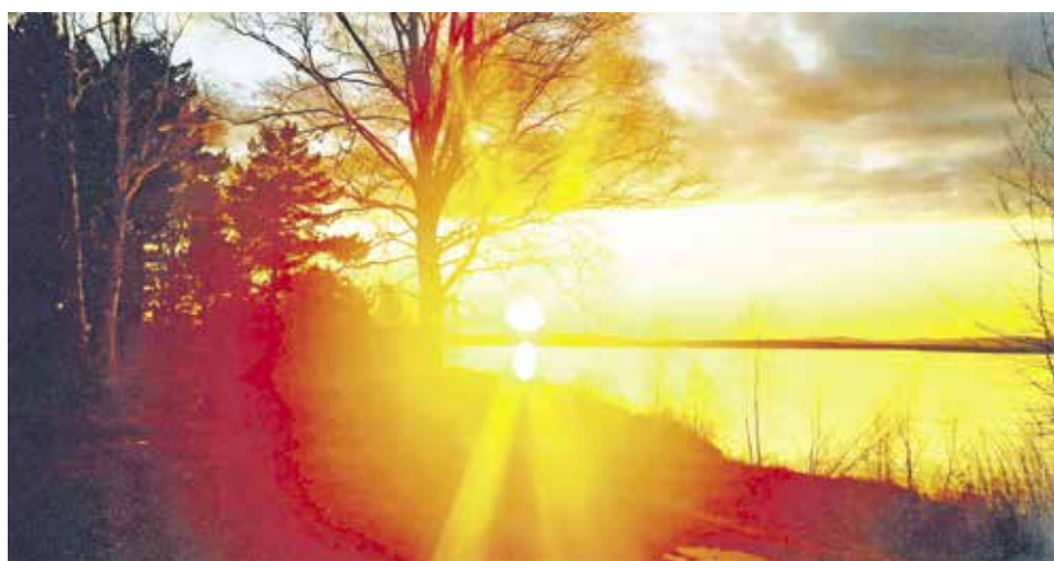
Крейнерт Фаина «Золото Амура»