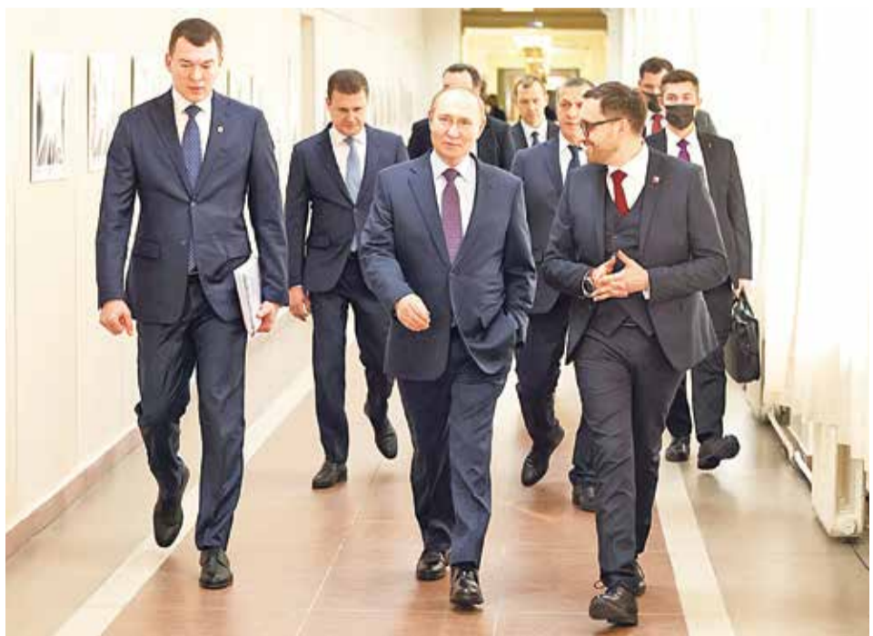
Президент Владимир Владимирович в ТОГУ

23,5 ТЫСЯЧИ многодетных семей в Хабаровском крае