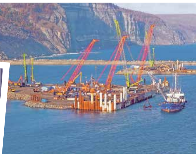
ФОТО: ПОРТ ЭЛЬГА

Владимир Владимирович, будьте уверены, Хабаровский край Президент не подведёт!