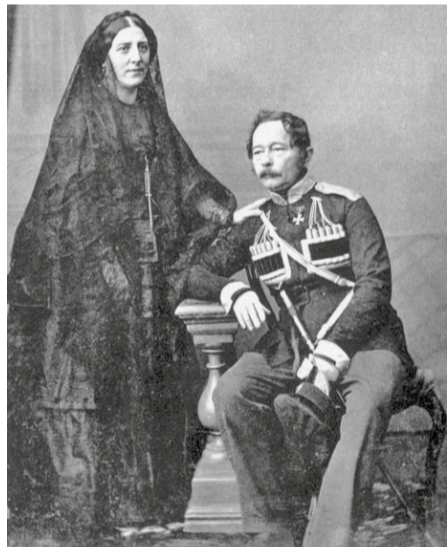
Николай Николаевич и Екатерина Николаевна Муравьевы-Амурские. Западная Европа, 1860 г. (Из фондов Государственного Исторического музея).