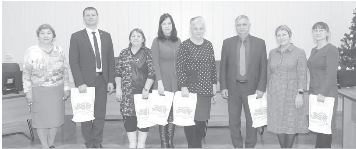
● Члены общественного совета Комсомольского района.

26 декабря состоялось заключительное в этом году заседание общественного совета Комсомольского муниципального района. Были рассмотрены вопросы, актуальные для жителей нашего района, представителями которых являются члены общественного совета.