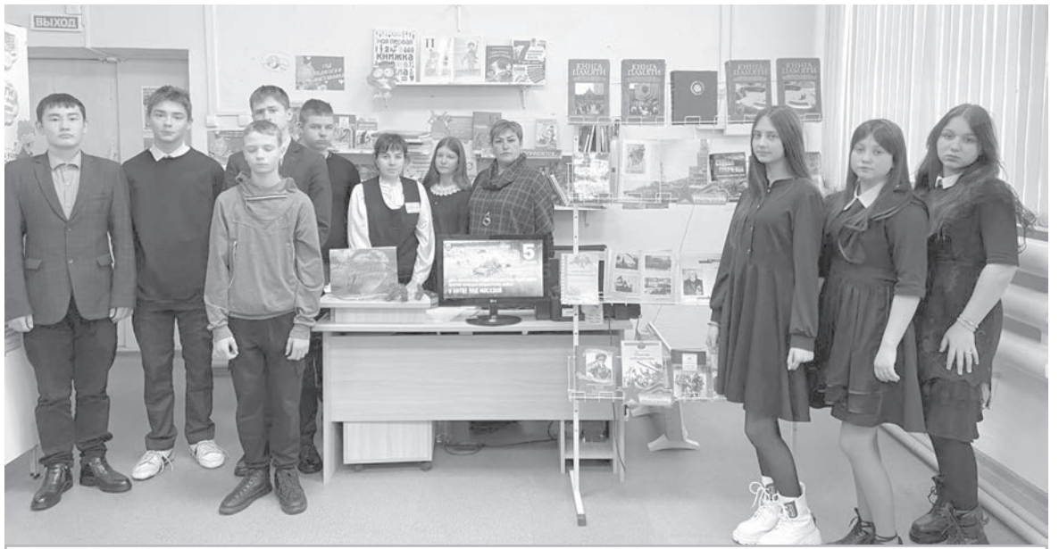
• Ребята восхищаются подвигами советских солдат и гордятся своими земляками.

На уроке мужества ребятам напомнили и о подвиге 3500 курсантов подольского артиллерийского и пехотного училищ. Курсантам была поставлена боевая задача: занять Ильинский боевой рубеж и преградить путь противнику на 5—7 дней, пока к Москве не подойдут резервы из глубины страны. В течение нескольких дней курсанты сдерживали наступление немцев, отбивая одну атаку за другой. Фашисты же, пораженные их храбростью, разбросали с самолета листовки со словами: «Красные юнкера, мы восхищены вашим мужеством, но ваше дело