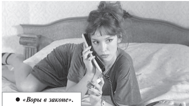
● «Воры в законе».

Самохина была человеком верующим, но, как назло, роли ей доставались отнюдь не «христианские». Тем не менее от неоднозначных ролей она не отказывалась. Даже когда актрису пригласили на роль Маргариты, согласилась, несмотря на мифы, которыми была ок-