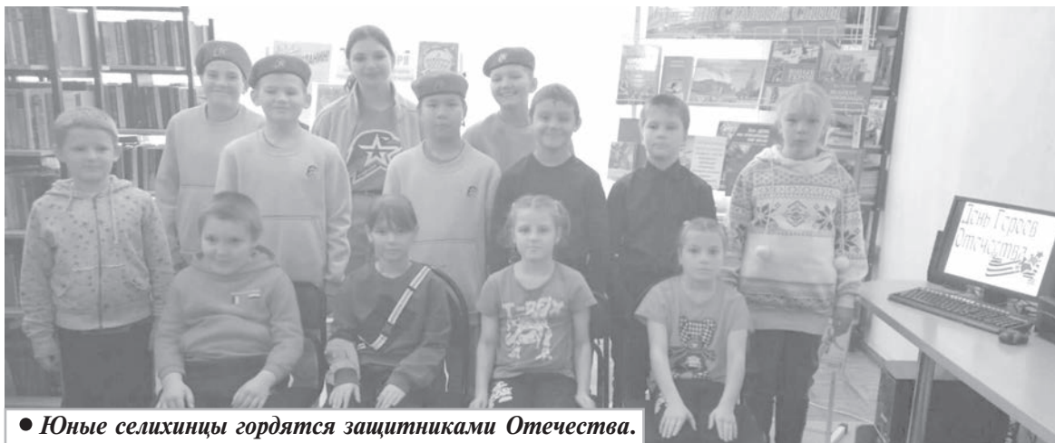
• Юные селихинцы гордятся защитниками Отечества.

В рамках Дня героев Отечества в Селихинской сельской библиотеке для школьников был проведен патриотический час «Слово во славу Героев».