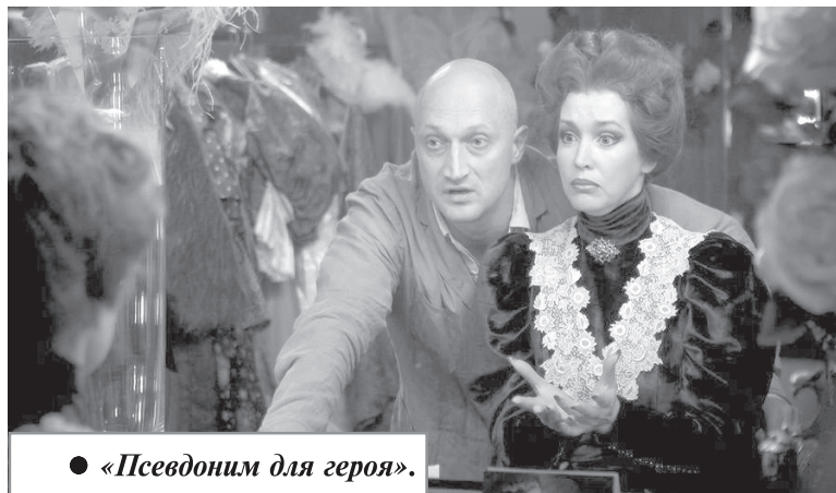
● «Псевдоним для героя».

Она должна была сыграть крестьянскую девушку Риту, любовницу главаря мафии.