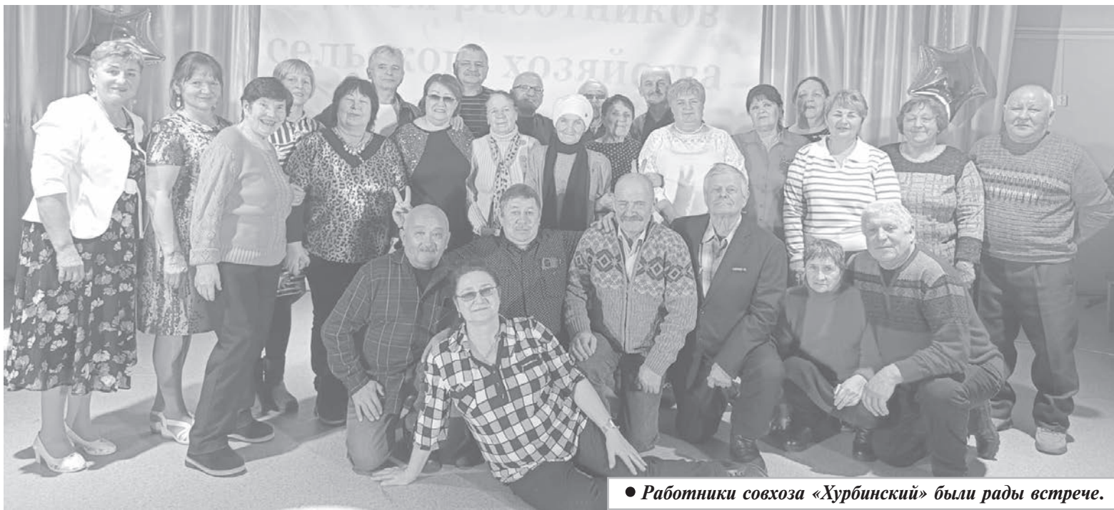
● Работники совхоза «Хурбинский» были рады встрече.

В преддверии новогодних праздников администрация сельского поселения «Село Новый Мир» организовала встречу бывших работников совхоза «Хурбинский», который как действующее предприятие начал вести свою летопись еще с 1937 года, а закончил трудовую биографию в 2000 году.