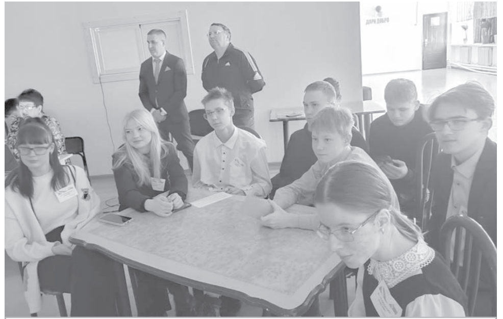
● За столами кипит накал страстей.

Т. СУТУРИНА, методист по музейной работе.