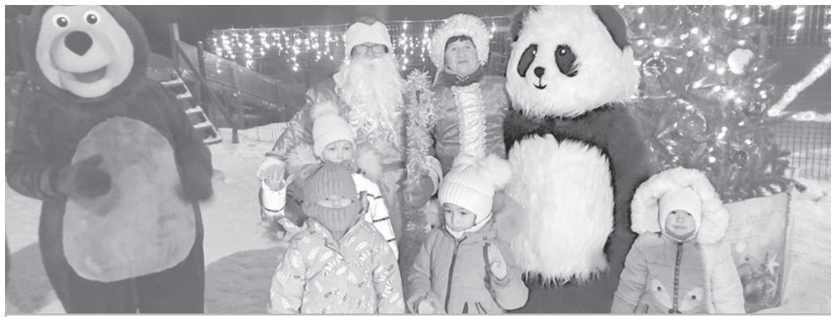
● А самых маленьких участников ждали сюрпризы!

В преддверии Нового года ТОС «Пионерия» в Селихино был реализован проект «Зимняя сказка». 24 декабря состоялось торжественное открытие елки на детской площадке по улице Пионерской.