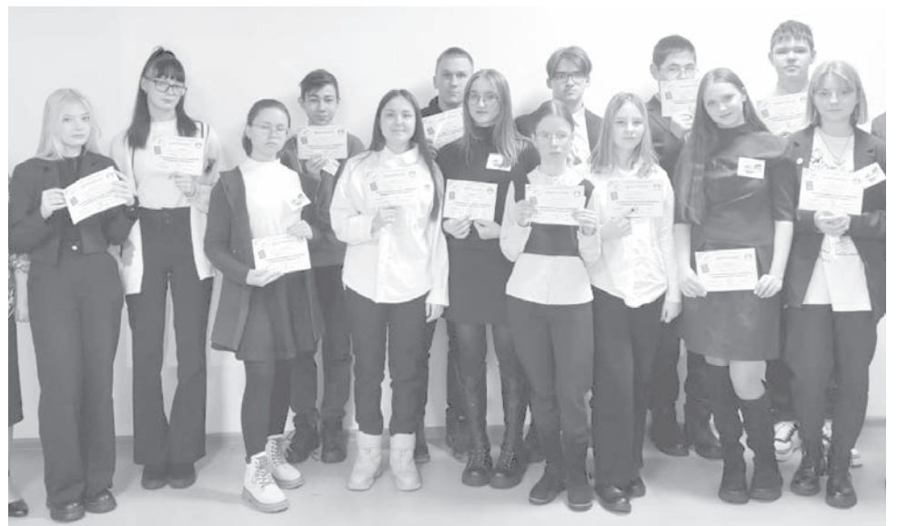
● Школьники продемонстрировали высокий уровень знаний по обществознанию.