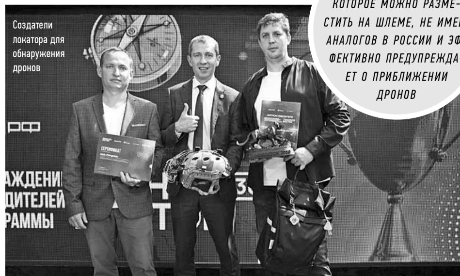
Создатели локатора для обнаружения дронов

КОМПАКТНОЕ УСТРОЙСТВО, КОТОРОЕ МОЖНО РАЗМЕСТИТЬ НА ШЛЕМЕ, НЕ ИМЕЕТ АНАЛОГОВ В РОССИИ И ЭФФЕКТИВНО ПРЕДУПРЕЖДАЕТ О ПРИБЛИЖЕНИИ ДРОНОВ