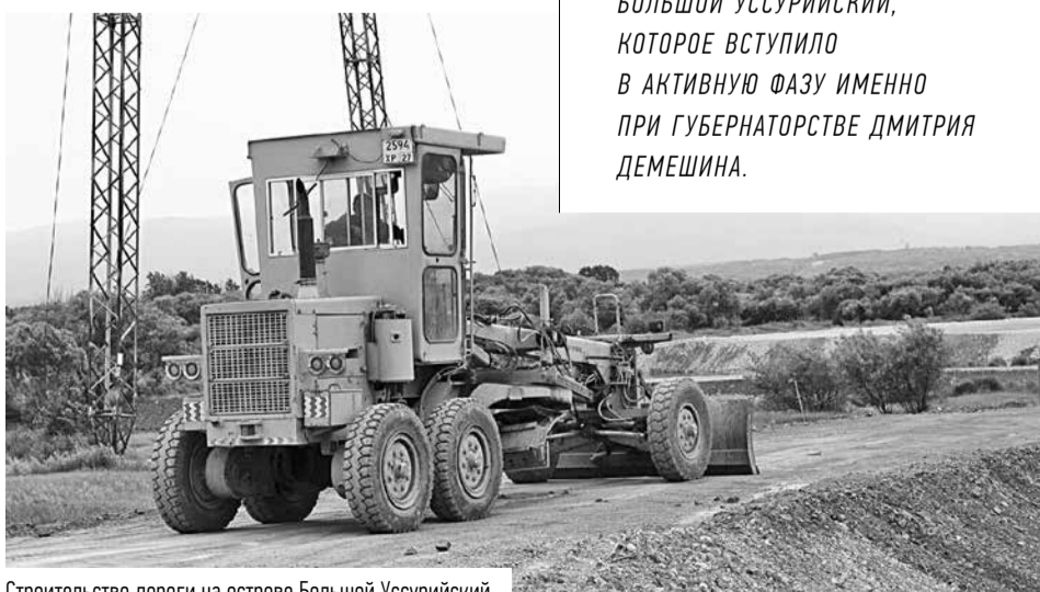
Строительство дороги на острове Большой Уссурийский

ОДНИМ ИЗ ВАЖНЕЙШИХ ПРОЕКТОВ ЯВЛЯЕТСЯ РАЗВИТИЕ ИНФРАСТРУКТУРЫ ОСТРОВА БОЛЬШОЙ УССУРИЙСКИЙ, КОТОРОЕ ВСТУПИЛО В АКТИВНУЮ ФАЗУ ИМЕННО ПРИ ГУБЕРНАТОРСТВЕ ДМИТРИЯ ДЕМЕШИНА.