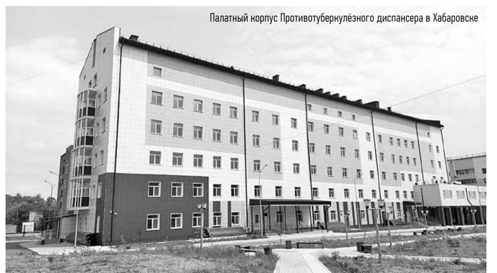
Палатный корпус Противотуберкулезного диспансера в Хабаровске

В Комсомольске-на-Амуре набережная уже полностью готова – в августе, по видеосвязи, ее официально открыл