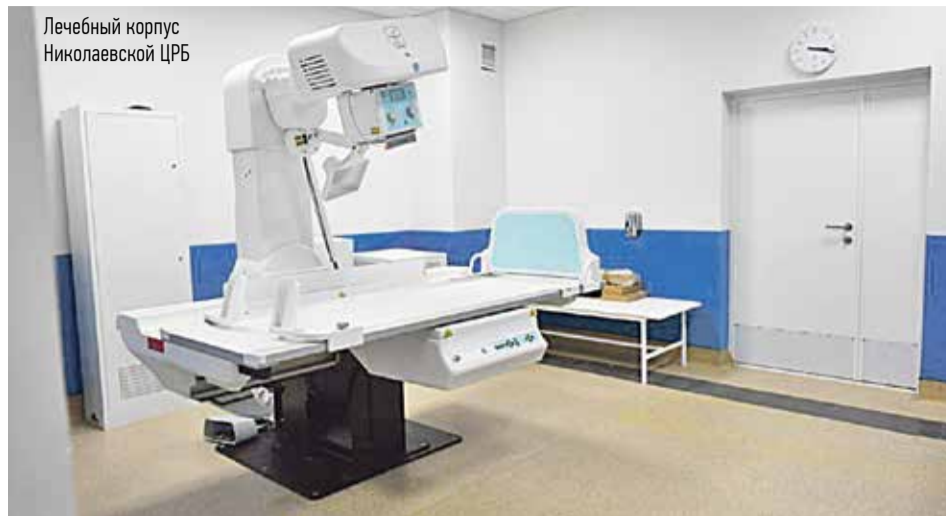
Лечебный корпус Николаевской ЦРБ