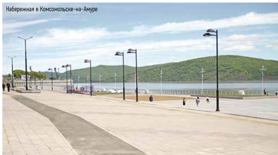
Набережная в Комсомольске-на-Амуре

Подтверждением экономической привлекательности Хабаровска стал недавний юбилейный Восточный экономический форум. За три дня его работы делегация региона во главе с губернатором провела более 30 рабочих встреч с потенциальными инвесторами и партнерами, подписано 24 соглашения на общую сумму 2,4 трлн рублей. По итогам форума регион стал лидером в ДФО по объему привлеченных средств.