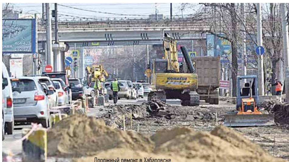
Дорожный ремонт в Хабаровске