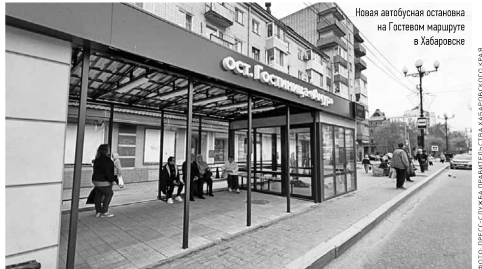
Новая автобусная остановка на Гостевом маршруте в Хабаровске