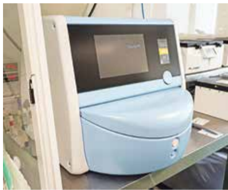
Новое оборудование Хабаровского перинатального центра

Медицинские учреждения уже заключили десятки контрактов на закупку специализированного оборудования: аппаратов для ингаляционной анестезии, ультразвуковых аппаратов, электроэнцефалографов, фетальных мониторов, инкубаторов для новорожденных, аппаратов для проведения управляемой лечебной гипотермии у новорожденных, аппаратов для реинфузии крови и многого другого.