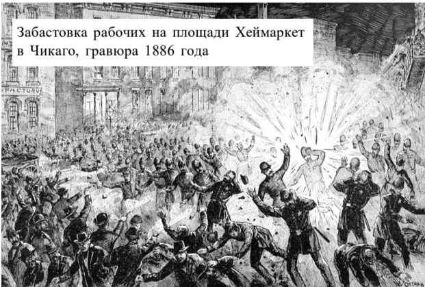
Забастовка рабочих на площади Хеймаркет в Чикаго, гравюра 1886 года

История праздника уходит корнями во времена борьбы за права рабочих в Соединенных Штатах в конце XIX века. 1 мая 1886 года в городах США начались митинги и демонстрации, а самым известным событием стала забастовка в Чикаго. Она переросла в открытую конфронтацию с полицией, известную как Хеймаркетская бойня (по названию площади, где она проходила).