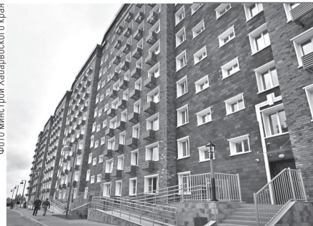
Фото министр Хабаровского края

5,12 млрд рублей выделено краю на первый этап программы переселения.