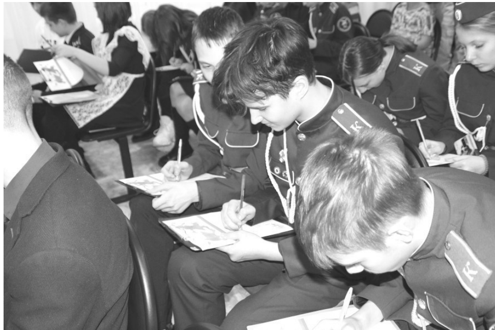
Акция «письмо солдату»