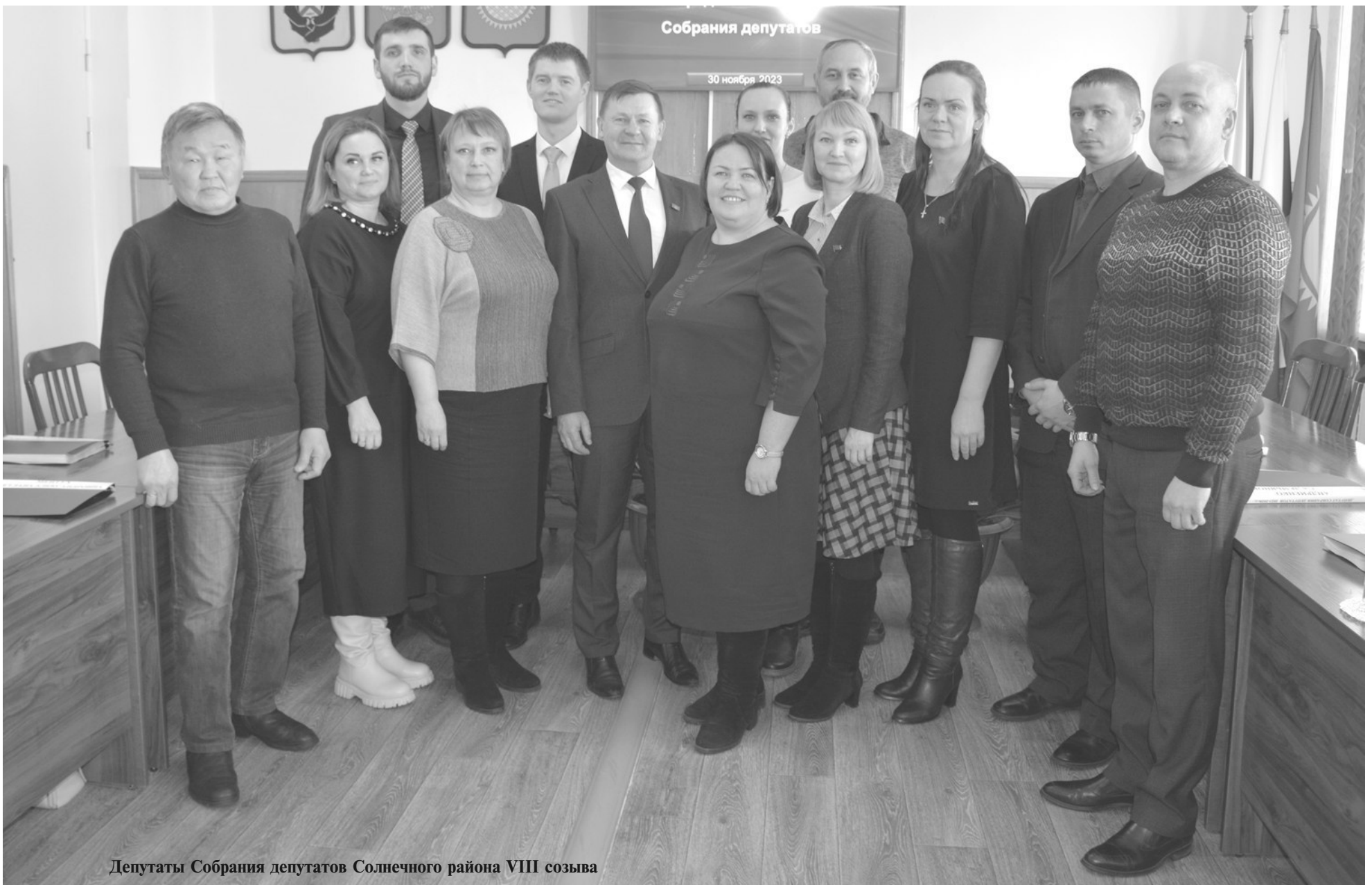
Депутаты Собрания депутатов Солнечного района VIII созыва