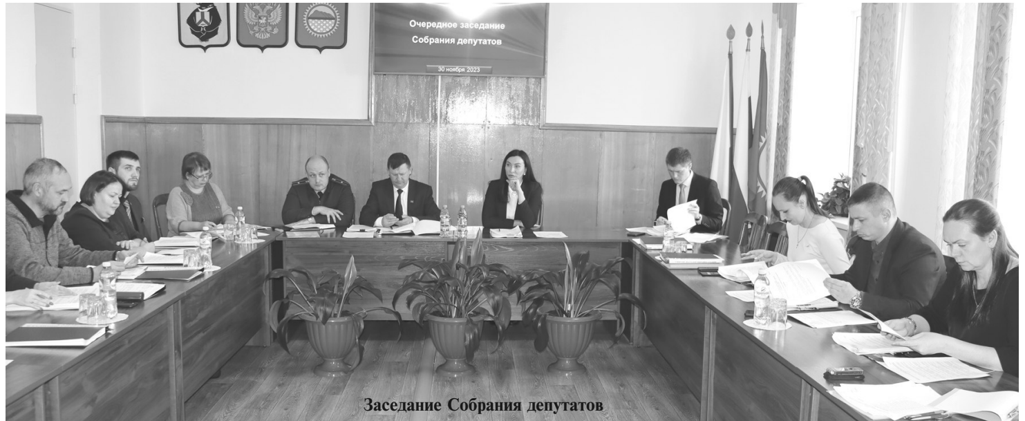
Заседание Собрания депутатов

2. О внесении изменений в отдельные нормативные правовые акты;