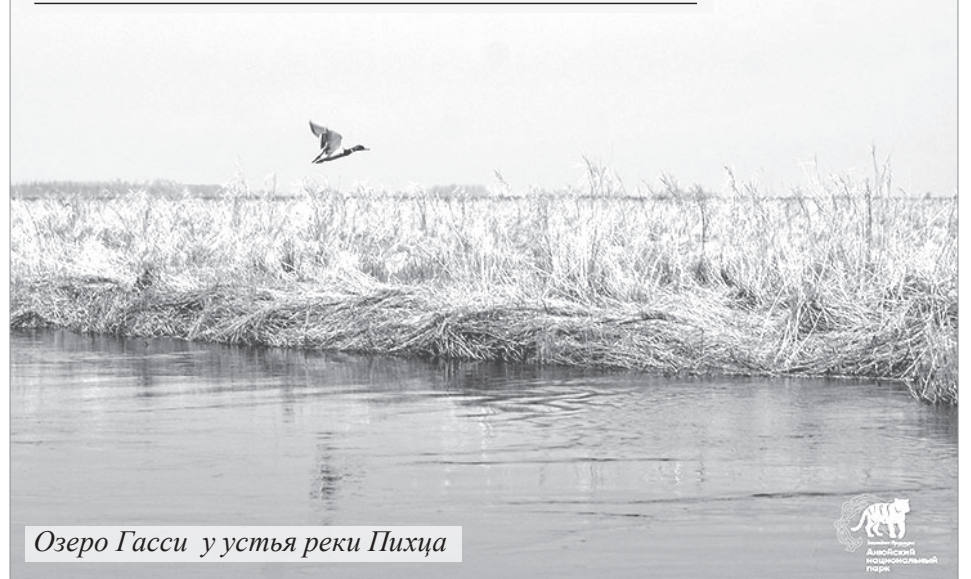
Озеро Гасси у устья реки Пихца

2 февраля - Всемирный день водно-болотных угодий