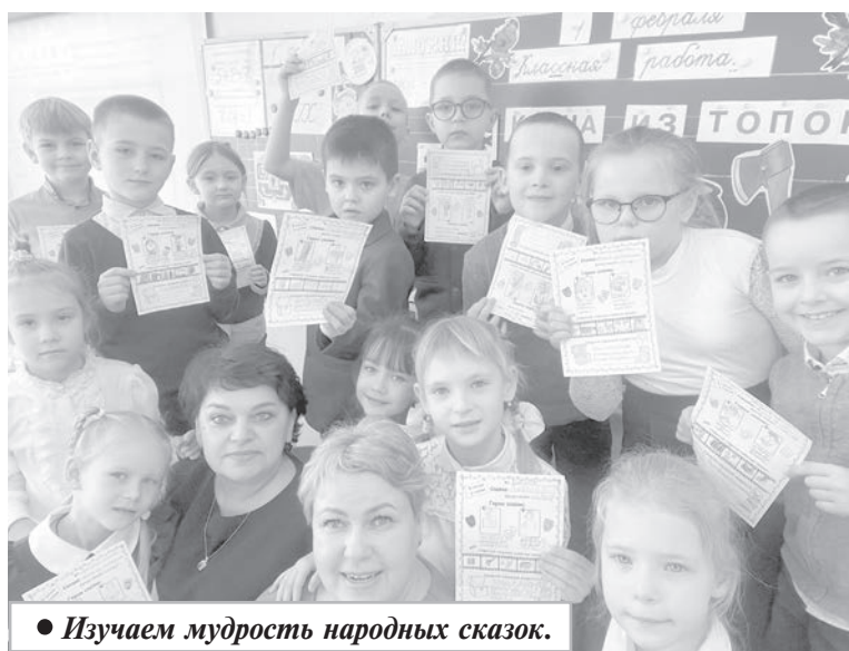
• Изучаем мудрость народных сказок.