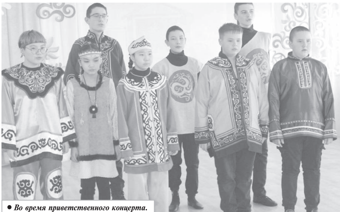
• Во время приветственного концерта.

— Сборы в Комсомольском районе проходят не первый год, что стало уже доброй традицией. И в этот раз все прошло очень позитивно и