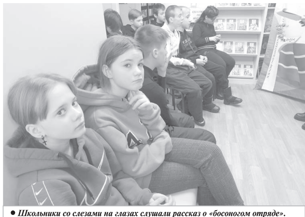
• Школьники со слезами на глазах слушали рассказ о «босоногом отряде».

тия узнали имена героев-подростков, которые помогали советским солдатам, ходили в разведку, приносили важные донесения. Ценой своей жизни дети вносили свой посильный вклад в победу. Судьба этих ребят была не простая, им очень рано пришлось повзрослеть. Те, кто не мог держать в руках оружие, писали листовки для жителей Сталинграда, в которых рассказывали людям о том, что наши войска наступают и обязательно победа будет за нами. Они старались поддержать дух горожан, призывали не верить фашистам.