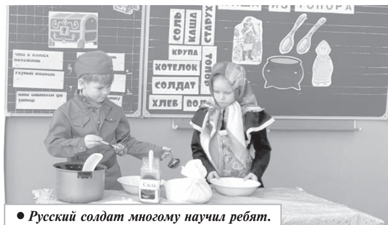
• Русский солдат многому научил ребят.