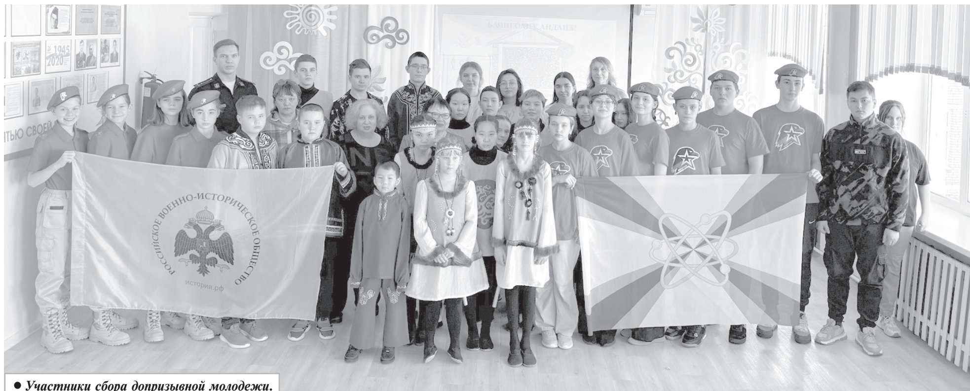
• Участники сбора допризывной молодежи.