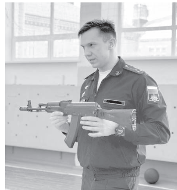
• Военнослужащий 12 Главного управления МО РФ проводит мастер-класс.

плодотворно, способствовало поднятию патриотического духа ребят, а также позволило им познакомиться с единомышленниками из других сельских поселений, об-