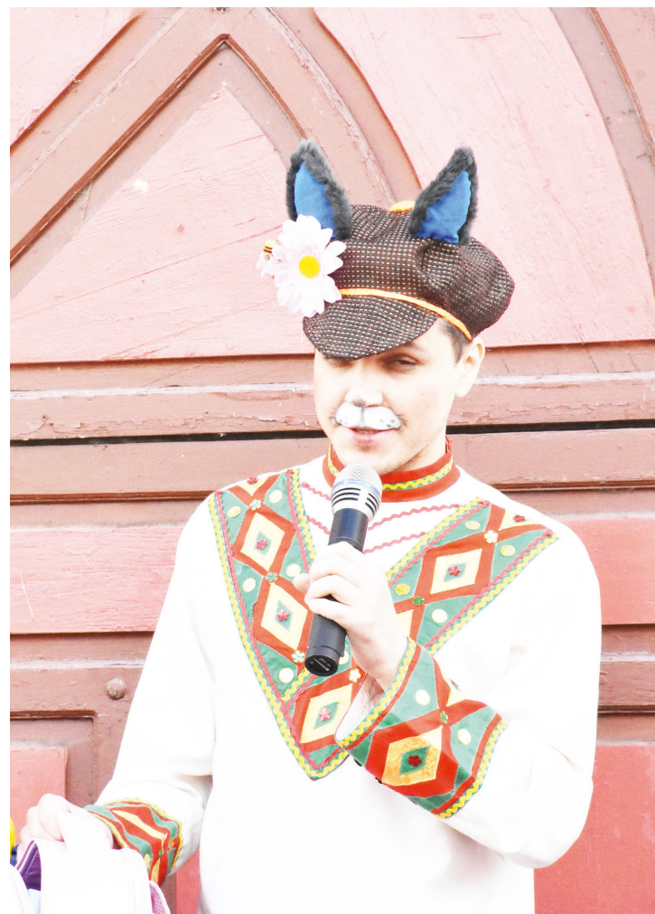
Во время представления герои постановки рассказали несколько забавных историй о своих родственниках и о том, как те готовились к школе, а затем интересовались, как прошли первые школьные деньки у ребят

Сезон в Театре юного зрителя откроется в воскресенье, 22 сентября, премьерной сказкой «Пойдём забодаем волка». Кроме того, в конце месяца стартует сезон и для взрослых зрителей: в субботу, 28 сентября, в ТЮЗе покажут спектакль «Баба Шанель» по пьесе современного драматурга Николая Коляды. В спектакле заняты не только ТЮзовцы, но и участники «Лаборатории актёра», уже в течение нескольких лет работающей при учреждении.