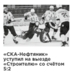
«СКА-Нефтяник» уступил на выезде «Строителю» со счётом 5:2