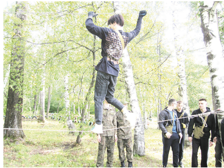
Первым этапом эстафеты была переправа по верёвке

На вопрос, что было для них самым сложным, участники из числа парней отвечали, что, в принципе, все преодолимо. А девочки в один голос заявили, что самой тяжёлой частью полосы препятствий стал бег в противогазах. Здесь можно сказать только одно: тяжело в ученье — легко в бою.