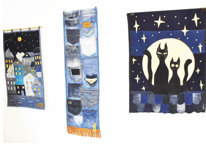
Картины на джинсах создали участницы студии «Винтаж» из Хабаровска