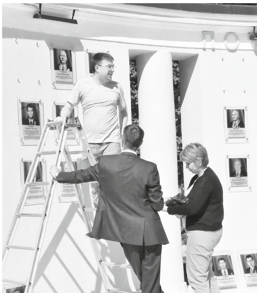
Фото установили на доску почёта после её ремонта, некоторые заменили на новые