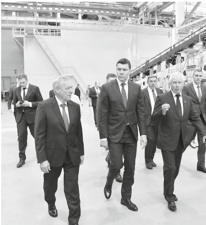
Антон АЛИХАНОВ в цехе КНААЗ, где производят комплектующие для импортозамещённого «Суперджета»

Делегация во главе с руководителем Минпромторга посетила Производственный центр ПАО «Яковлев», который выпускает ближнемагистральные самолёты SJ-100. Телеграм-канал «ПАО «ОАК»» сообщает, что на площадке предприятия министр ознакомился с работой центра специализации ОАК «Двери и люки», где идёт сборка агрегатов для МС-21, а также посетил цех окончательной сборки и лётно-испытательную станцию, где заслушал доклады о ходе работ по опытным и серийным самолётам SJ-100.