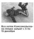
Все катки Комсомольска-на-Амуре закрыты с 5 по 15 декабря