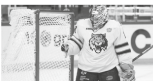
Победную серию ХК «Амур» прервал лидер регулярного чемпионата