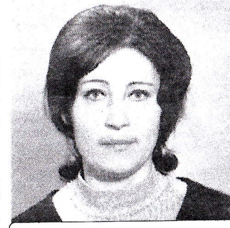
Нелли Александровна в студенчестве

После окончания девятилетней школы я сначала работала лаборантом на заводе, а