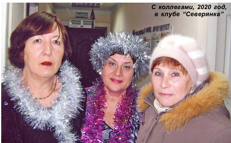
С коллегами, 2020 год, в клубе "Северянка"

новник торжества - ребёнок, то хорошей учёбы в школе или колледже.