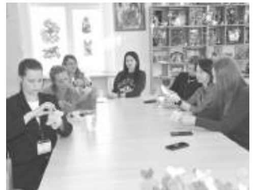
Создание игрушки из синельной проволоки