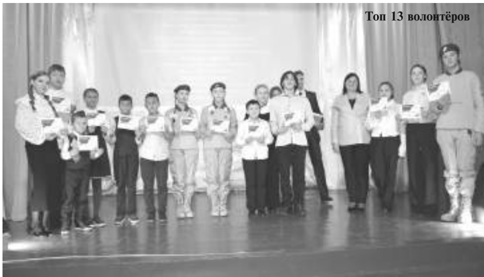
Топ 13 волонтеров

Особо трепетным моментом в программе мероприятия стало посвящение в «Хранители истории» и торжественная клятва. В ней участники посвящения поклялись хранить верность истории, чтить память защитников Отечества и бережно относиться к культурному на-