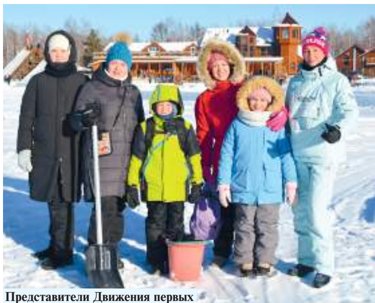
Представители Движения первых