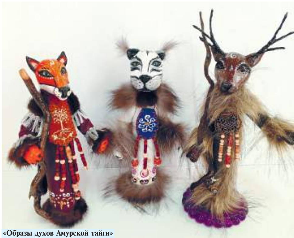
«Образы духов Амурской тайги»