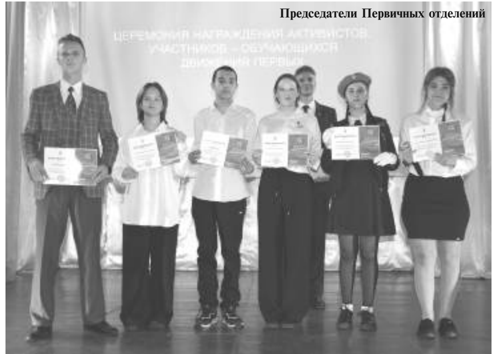
Председатели Первичных отделений