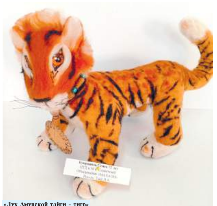
«Дух Амурской тайги - тигр»