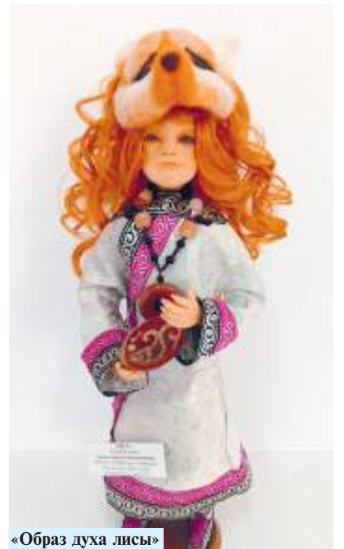
«Образ духа лисы»