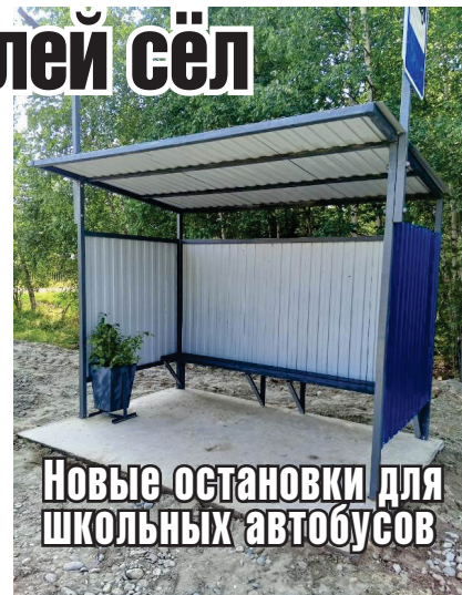
Новые остановки для школьных автобусов

Все работы выполнены для обеспечения безопасности детей на дорогах сёл района.