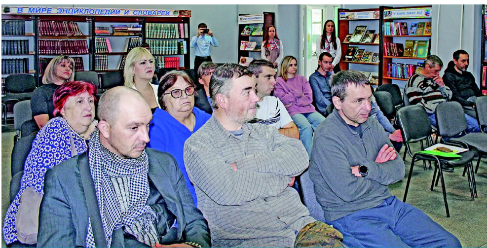
Участники ярмарки рабочих вакансий