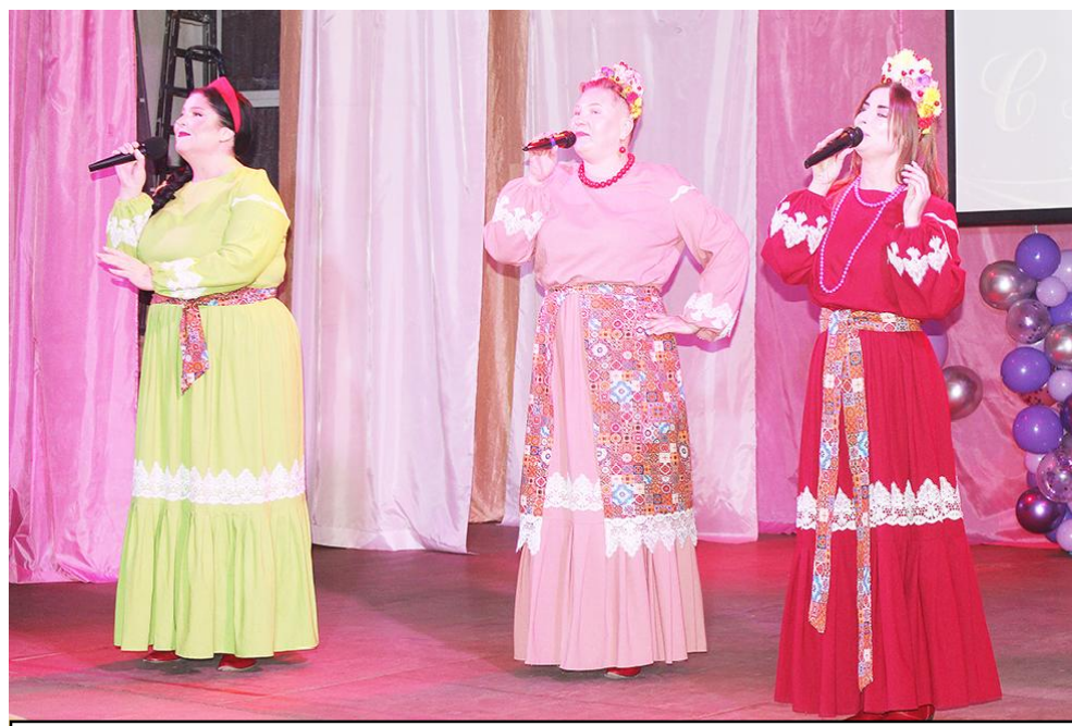
Выступает ансамбль народной песни "Забава"