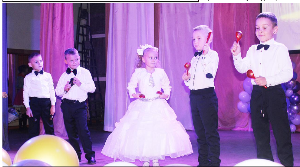
Юные ложкари из ансамбля "Россияночка" (руководитель О. Иванченко)