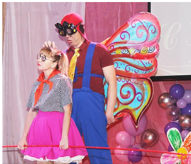
Творческий подарок коллегам от театра "Диалог"