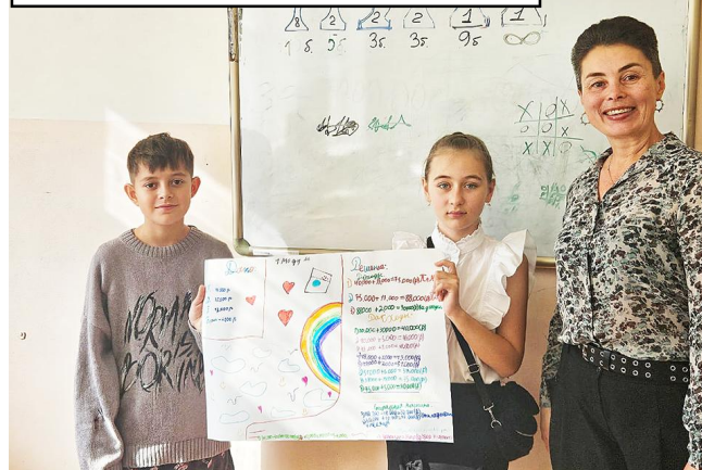
Команда учащихся средней школы № 3 имени А.И. Томилина

другим людям. Гораздо эффективнее освоить теорию планирования бюджета и самостоятельно принимать решения о том, как использовать свои средства,