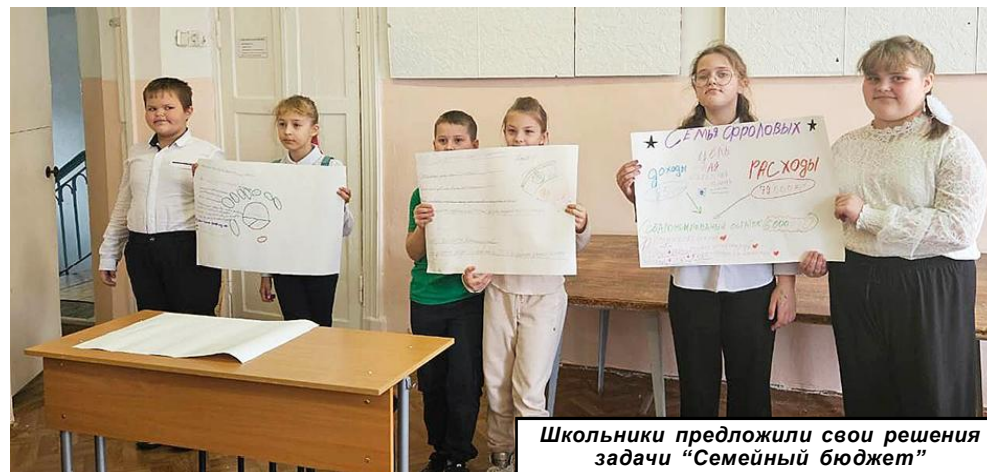
Школьники предложили свои решения задачи "Семейный бюджет"