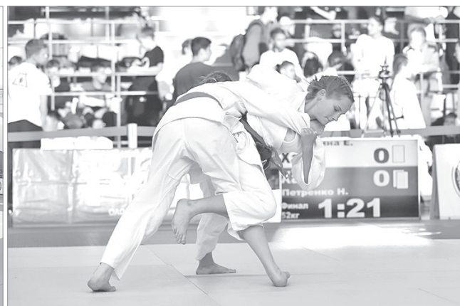
Непросто одолеть соперниц из республики Саха (Якутия), Хабаровского края и Амурской области!