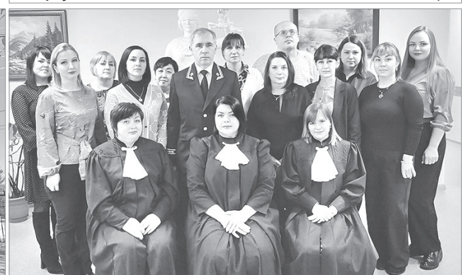
Коллектив Нанайского районного суда, 2024 г.