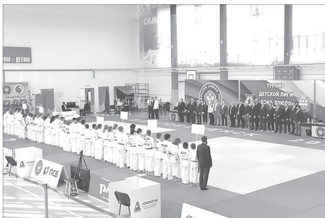
В турнире принимают участие спортсмены Магаданской, Сахалинской и Ленинградской областей, Республик Бурятия и Саха (Якутия), Приморского, Забайкальского и Хабаровского краев.