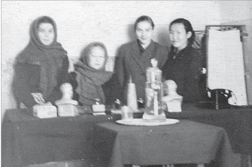
Старейшие работники Нанайского народного суда