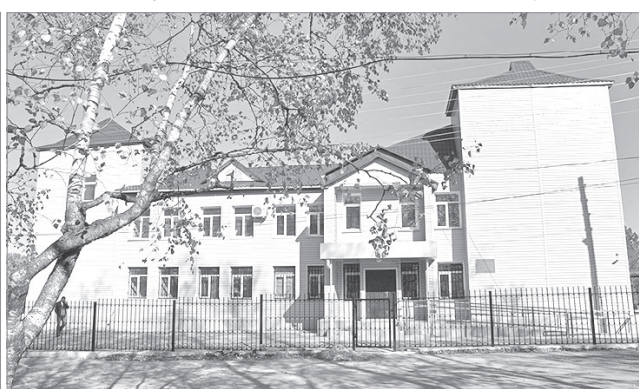
Здание Нанайского районного суда