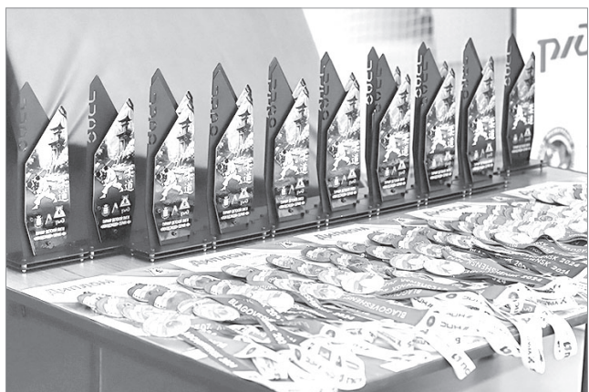
Красивые медали, грамоты, кубки и подарки участникам!