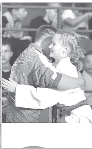
Эмоции после финала крупнейшего на ДВ турнира.