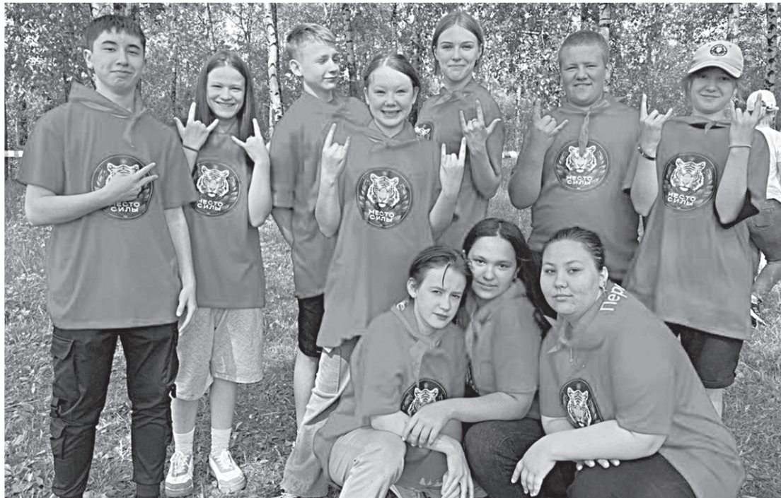
Наши призёры Всероссийского конкурса