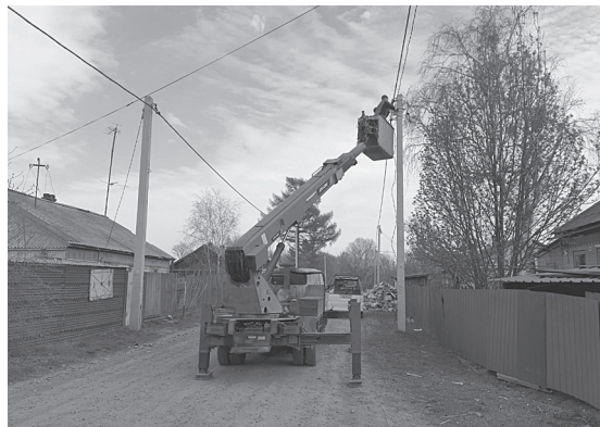
На ул. Заозерной проведено уличное освещение, асфальт уложен во дворе дома № 6 по ул. Бойко-Павлова

Чтобы условия для жизни стали лучше, нужно приложить усилия, именно так работают ТОСы, где граждане принимают активное участие, которым небезразлична судьба своего двора, села или поселка в целом. Совместными усилиями с муни-