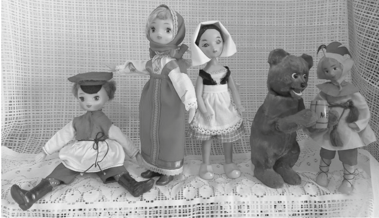
Костяк коллекции составляют советские игрушки

Секрет, что игрушки в виде человека, сделанные из ткани, фарфора, пластика, являются традиционным увлечением многих поколений детей.