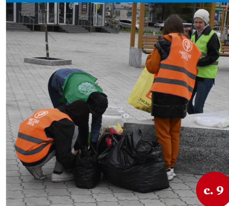
Экологическую акцию провели в Комсомольске