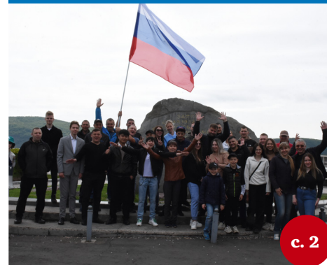
Более 20 машин приняли участие в акции