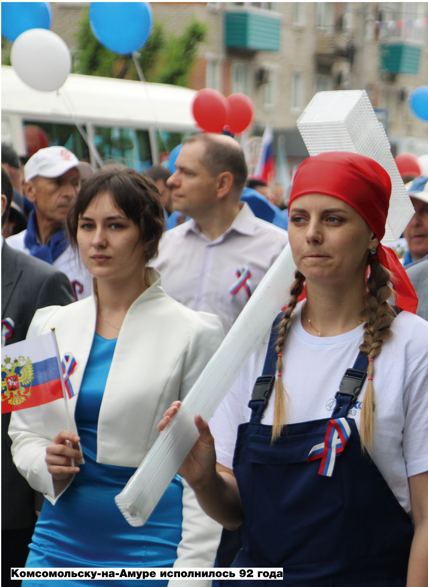
Комсомольску-на-Амуре исполнилось 92 года