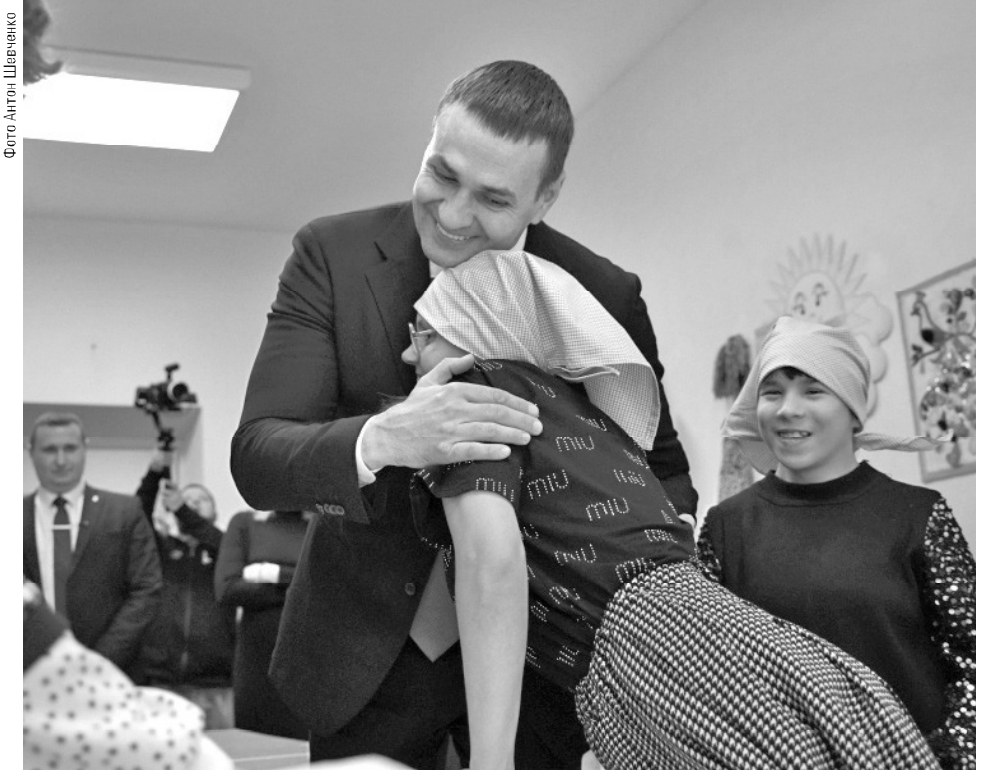
БЛАГОТВОРИТЕЛЬНЫЙ ПРОЕКТ «БЫТЬ РЯДОМ» ПОМОГАЕТ РЕБЯТАМ СОЦИАЛИЗИРОВАТЬСЯ.

– Спортивный зал нужно дооснастить современным инвентарем, – сказал глава региона. – Это важное