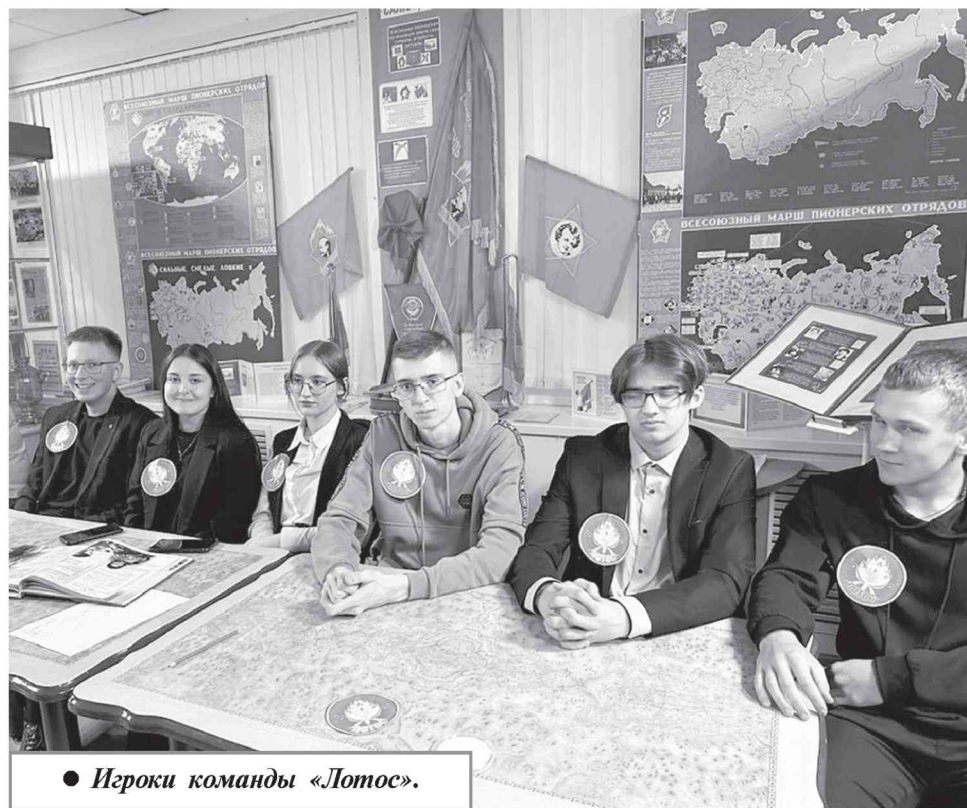
● Игроки команды «Лотос».

Брейн-ринг помог ребятам стать дружнее, сплотиться ради достижения результата. Ну а когда победа добыта в борьбе среди равных, она вдвойне ценнее. По итогам определились лидеры — это участники ко-