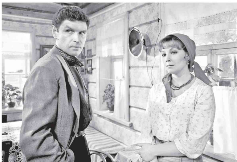
● Ольга Остроумова и Вадим Спиридонов в фильме «Судьба» (1977 год).

Яркие, необычные мужчины нравятся женщинам. Вот и герой Спиридонова вызвал наибольший интерес у женской аудитории. Как только «Вечный зов» показали по телевидению, на актера посыпался целый шквал писем от неравнодушных гражданок Со-