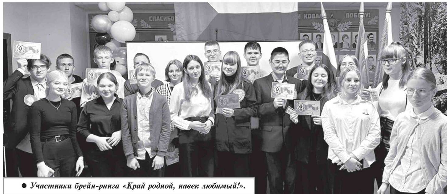
● Участники брейн-ринга «Край родной, навек любимый!».

манды «Лотос», «Тигры» заслуженно взяли второе место. Все игроки получили памятные дипломы.