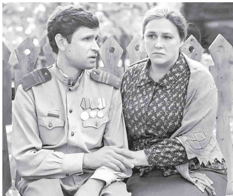
● Нонна Мордюкова и Вадим Спиридонов в фильме «Трясина» (1977 год).

Публика заговорила, что Спиридонов приехал в Москву из Сибири, где чуть ли не отси- дел в колонии. Актера очень обижала такая слава. К нему