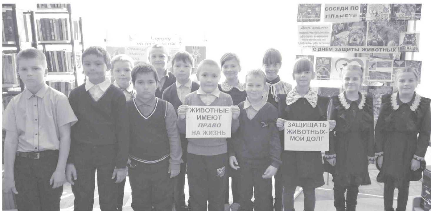
● Ученики третьего класса школы с. Селихино — участники тематического часа.

По информации Всемирного фонда дикой природы, каждый час на Земле исчезают три вида животных, 70 видов флоры и фауны планеты гибнут ежедневно, а четверть всех представителей экосистемы перестанут существовать в ближайшее время. Так, учрежденный несколько десятилетий назад Международный день защиты животных направлен на то, чтобы обратить внимание человечества на данную проблему. И очень важно всем нам осознать глобальность этой беды и как можно раньше начинать прививать