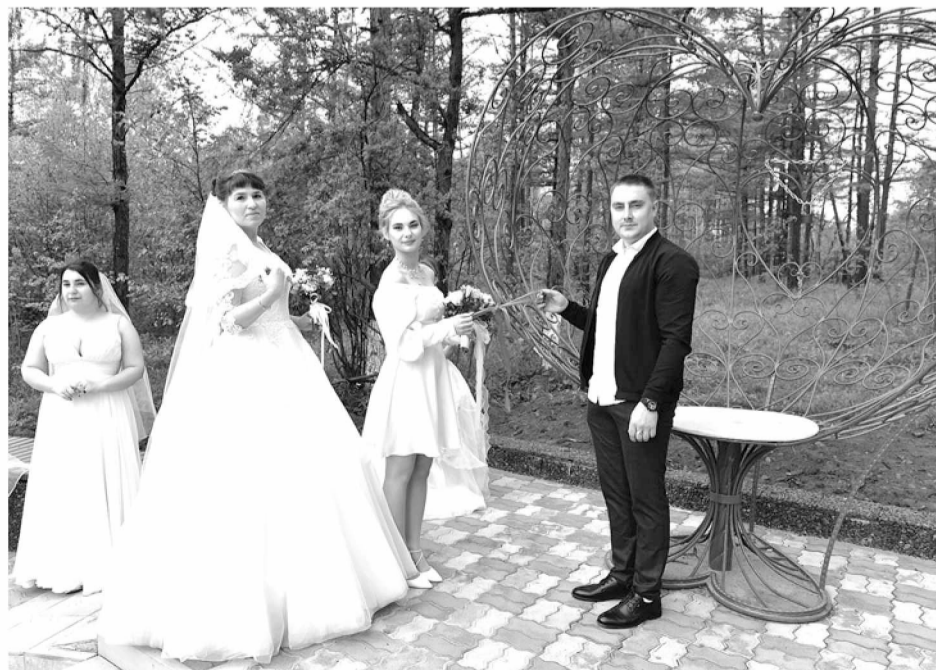
Благоустроенная площадка для молодожёнов в парке Победы