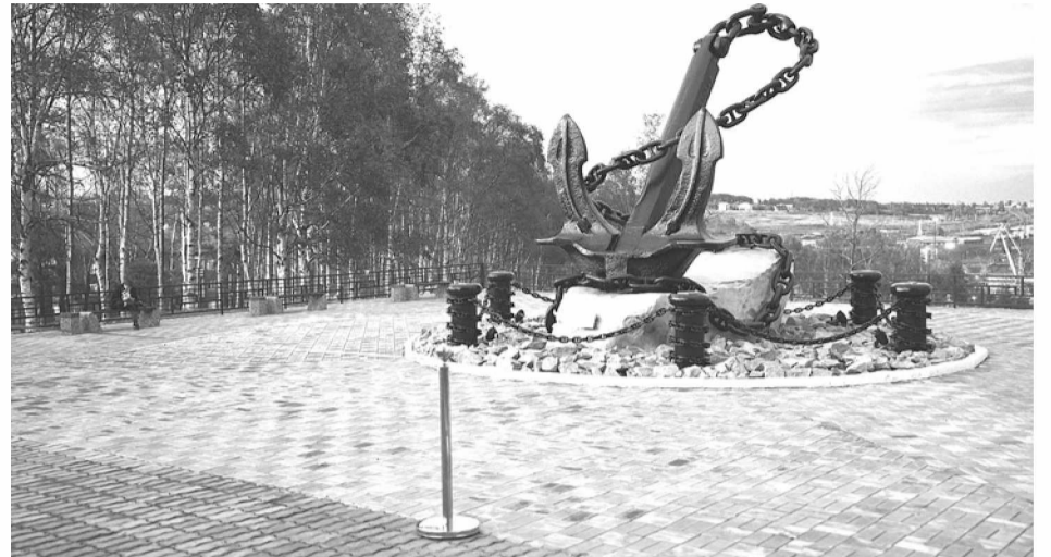
Новая смотровая площадка возле РДК

- Нет. В рамках данной программы действует подпрограмма "Благоустройство сельских территорий", в которой принимаем участие на протяжении трёх лет. В 2022 году было реализовано всего три проекта, а в 2023-м - уже девять. В текущем году реализо-