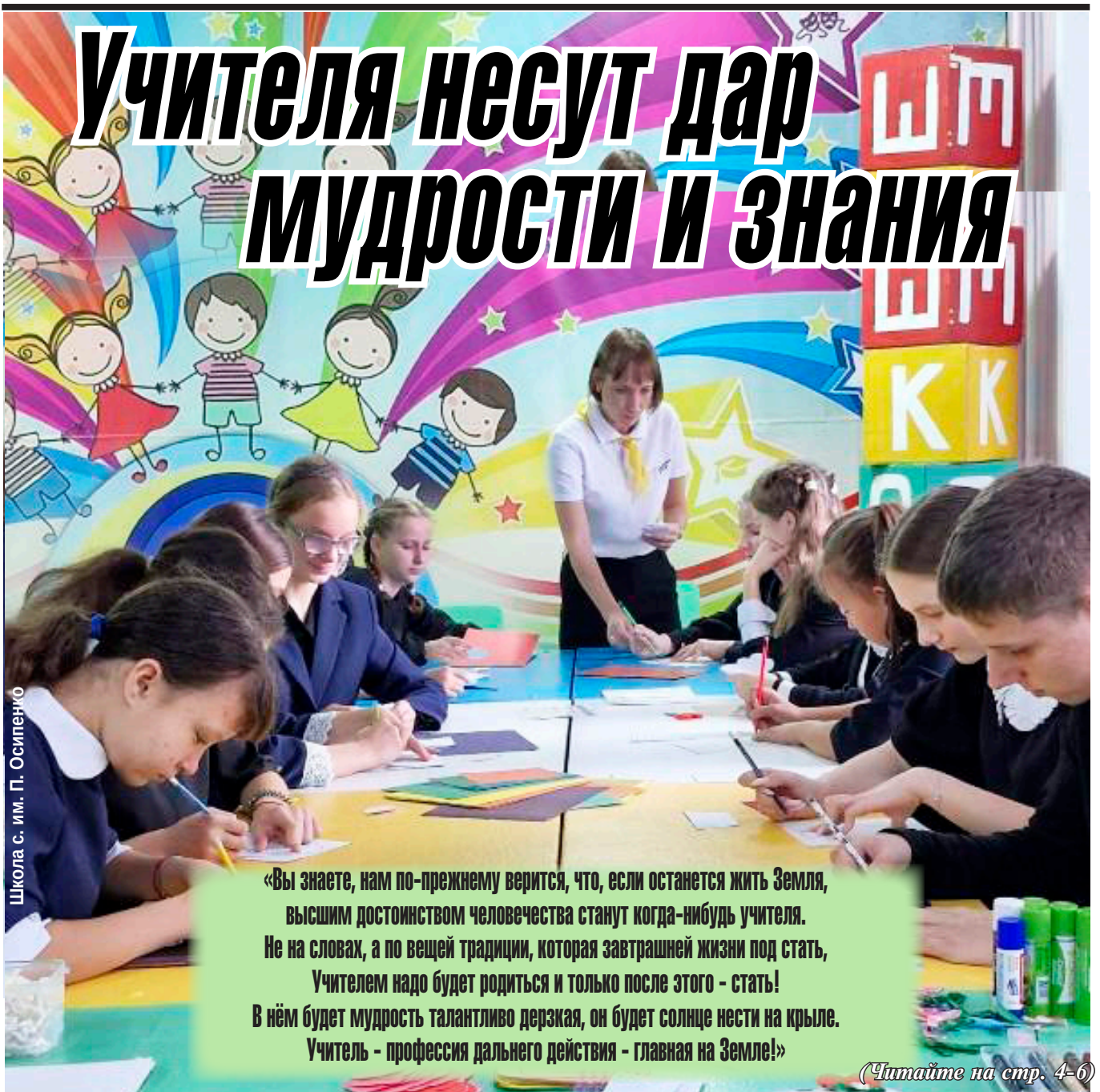
Школа с. им. П. Осипенко

«Вы знаете, нам по-прежнему верится, что, если останется жить Земля, высшим достоинством человечества станут когда-нибудь учителя. Не на словах, а по вещи традиции, которая завтрашней жизни под стать, Учителем надо будет родиться и только после этого - стать! В нём будет мудрость талантливо дерзкая, он будет солнце нести на крыле. Учитель - профессия дальнего действия - главная на Земле!»