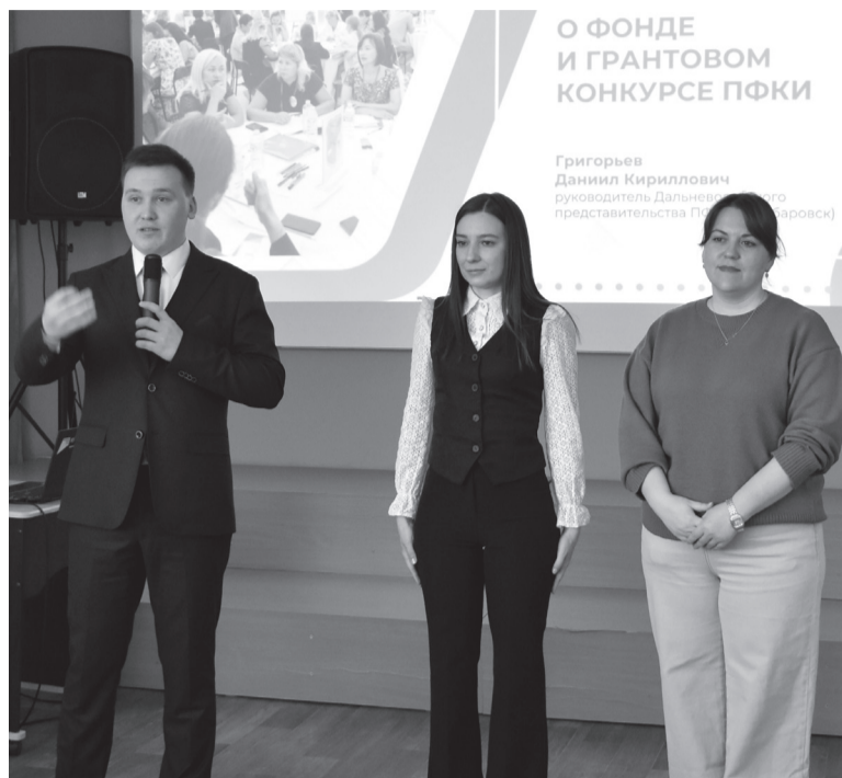
О ФОНДЕ И ГРАНТОВОМ КОНКУРСЕ ПФКИ

– Да нет, конечно! На самом деле, у вас по сравнению с другими муниципалитетами всё, можно сказать, неплохо. Начиная с 2021 года, от вашего района подана 51 заявка на участие в проектах, из них поддержано 10. Получается, каждый пятый проект одобрен, а в целом по стране только каждый восьмой. Конверсия весьма неплохая. Сумма привлеченных средств у вас составила почти пять миллионов рублей. Между прочим, ваши проекты также участвуют в подведении итогов, который будет в конце апреля. Наде-