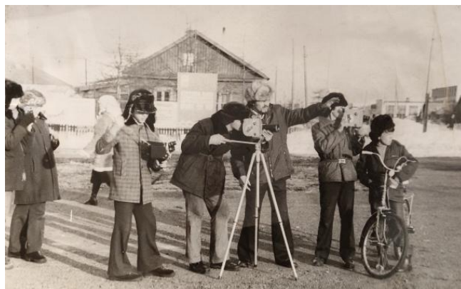
Студия «Север» снимает первый фильм