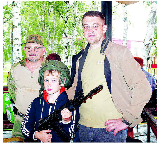
Локация "Рокота" вызвала большой интерес у юных совгаванцев