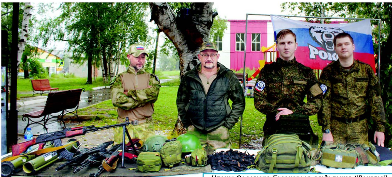
Члены Советско-Гаванского отделения "Рокота" демонстрировали образцы вооружения Российской и Советской армий

В ярмарке, инициированной региональной общественной организацией волонтерского движения "ЗА ПОБЕДОЙ ВМЕСТЕ", приняли участие общественные, образовательные организации, СНТ, творческие объединения, индивидуальные предприниматели.