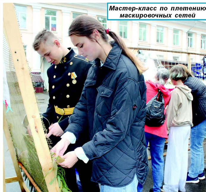
Мастер-класс по плетению маскировочных сетей