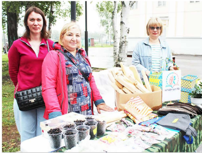
Педагоги школы-интерната № 20 со своей продукцией

ки, поблагодарила всех земляков за то, что, несмотря на непогоду, они пришли и внесли свой вклад в дело борьбы за ПОБЕДУ!