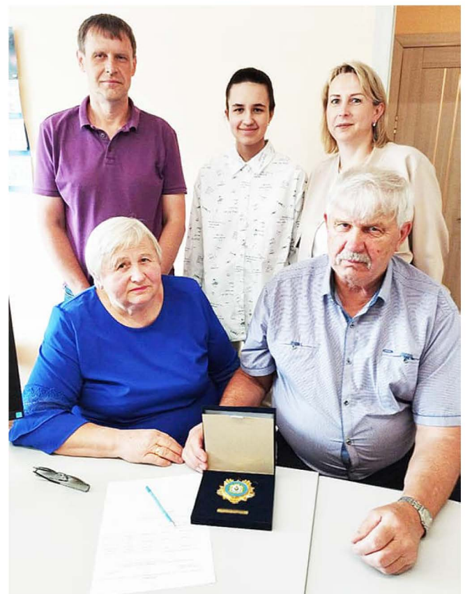
П. ИВАНИЦКАЯ

Подать заявление на получение Памятного знака и выплаты к нему необходимо в Многофункциональном центре (МФЦ) по адресу: г. Советская Гавань, ул. Калинина, д.5.