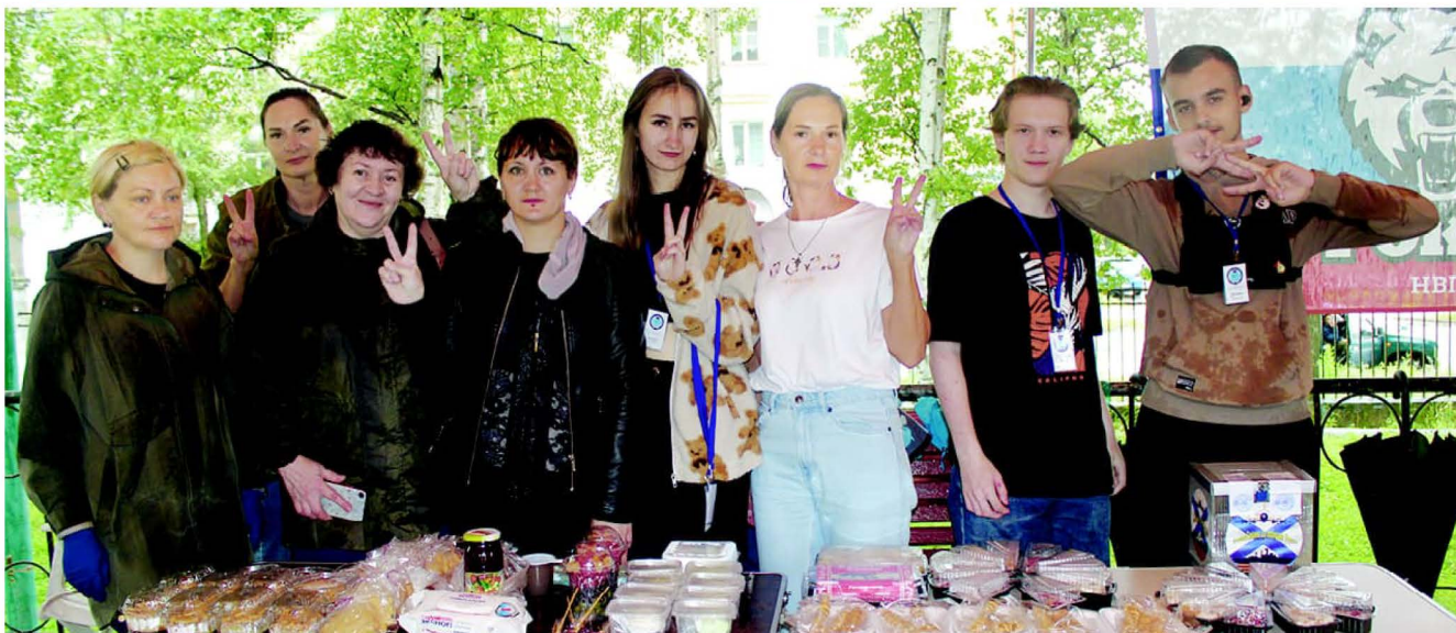
Преподаватели и студенты Советско-Гаванского промышленно-технологического техникума: вместе победим!

Члены региональной общественной организации волонтерского движения "ЗА ПОБЕДОЙ ВМЕСТЕ" представили на своей локации маскировочные изделия, которые они изготавливают по заказу бойцов, находящихся на передовой. Также здесь демонстрировалась комплектация посылок, регулярно отправляемых нашим землякам, воюющим с неонацистами. А ещё здесь можно было приобрести брендированные термосы, кружки, различную сувенирную продукцию.