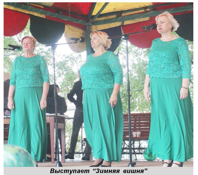
Выступает "Зимняя вишня"