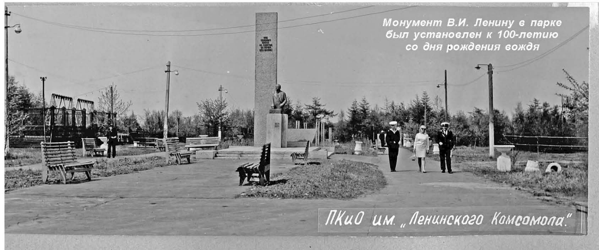
Монумент В.И. Ленину в парке был установлен к 100-летию со дня рождения вождя