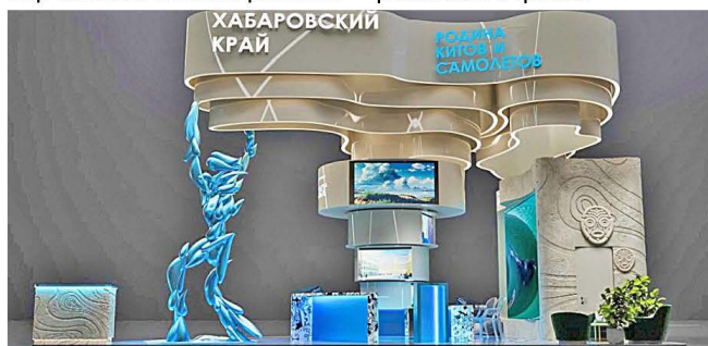
По информации пресс-службы губернатора и правительства Хабаровского края

Напомним, провести Международную выставку-форум "Россия" 29 марта поручил Президент страны Владимир Путин. Она должна показать достижения государства в различных отраслях экономики. В выставке примут участие 89 регионов страны.