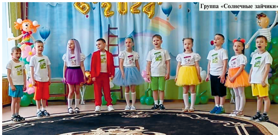
Группа «Солнечные зайчики»