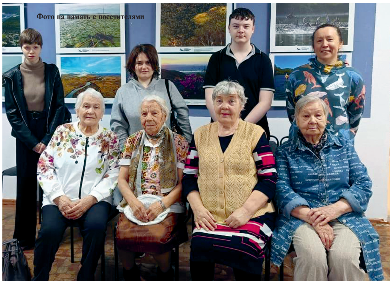
Фото на память с посетителями