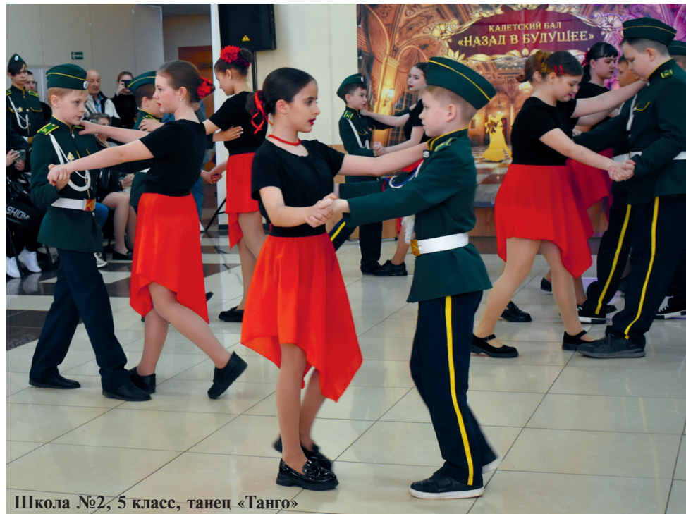
Школа №2, 5 класс, танец «Танго»