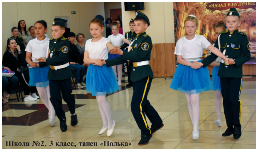
Школа №2, 3 класс, танец «Полька»