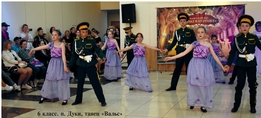
6 класс. п. Дуки, танец «Вальс»