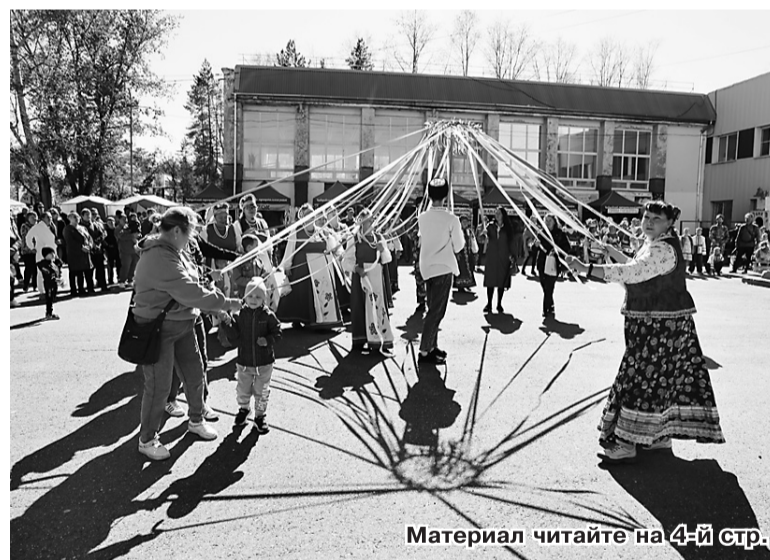
Материал читайте на 4-й стр.