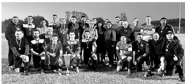
Подготовил Виталий ИВАНОВ.

Отметим, что спортивное состязание проводится ежегодно с 2000 года.